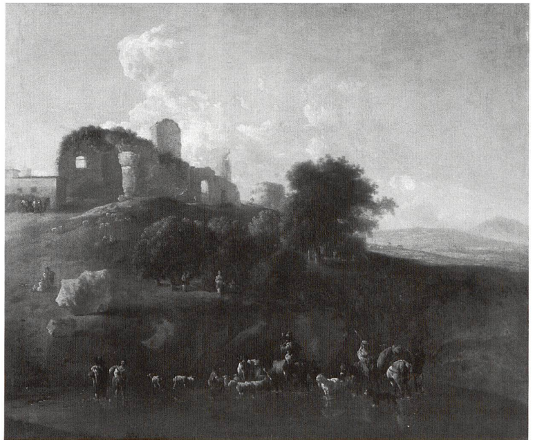
1 Karel Dujardin, Paysage, sans date, huile sur toile, 60 × 74 cm, Musée d'art et d'histoire, Neuchâtel.