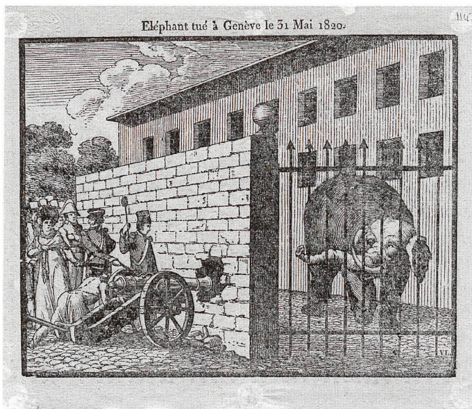
6 Eléphant tué à Genève le 31 mai 1820. – Le pachyderme fut abattu d'un coup de canon, après avoir été enfermé dans une cour de la caserne de Hollande. Sa dépouille fut conservée au Musée d'histoire naturelle.

paraître, se pérennisent à travers des constructions en dur, tel le premier cirque édifié en 1864 du côté de la rue des Savoises. Bêtes venues d'ailleurs et chevaux ont désormais un lieu permanent, signalé par le toponyme «place du Cirque». Certains prodiges trouveront quant à eux d'autres scènes, selon l'intérêt scientifique porté à leur numéro. Parmi eux, la palme revient peut-être au chien Minos qui, en janvier 1878, fait salle comble au Palais de l'Athénée, haut lieu de la culture genevoise.