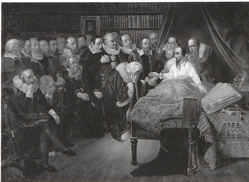
Joseph Hornung, Les Adieux de Calvin , v. 1840, Musée historique de la Réformation, Genève, exposé au Musée international de la Réforme, Genève.