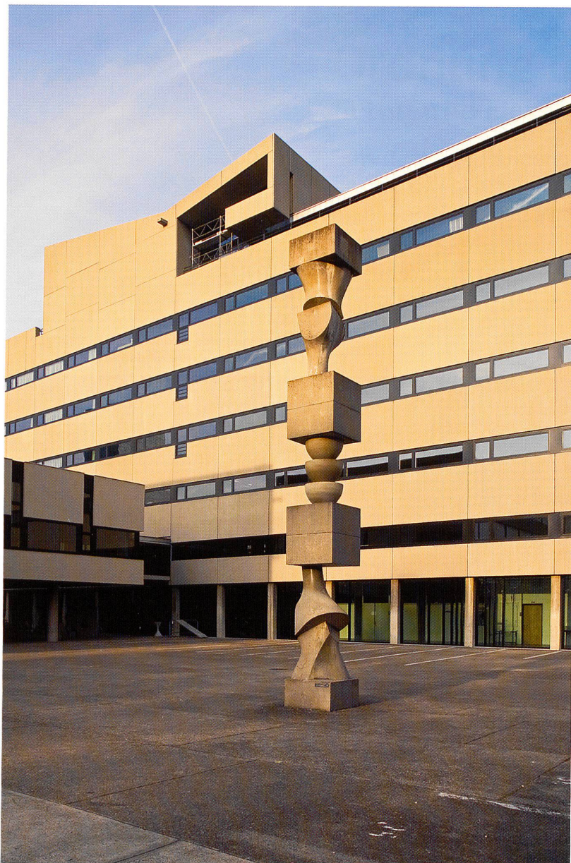
Im Zentrum: die 8 Meter hohe Säule von Hans Arp dominiert den Innenhof

A l'origine du scénario de Hermann Baur, la liaison entre les usages principaux des différents corps de bâtiment: un bâtiment principal sur cinq étages pour la section des métiers d'arts, un bâtiment transversal à deux étages pour la section générale, l'administration et les ateliers.