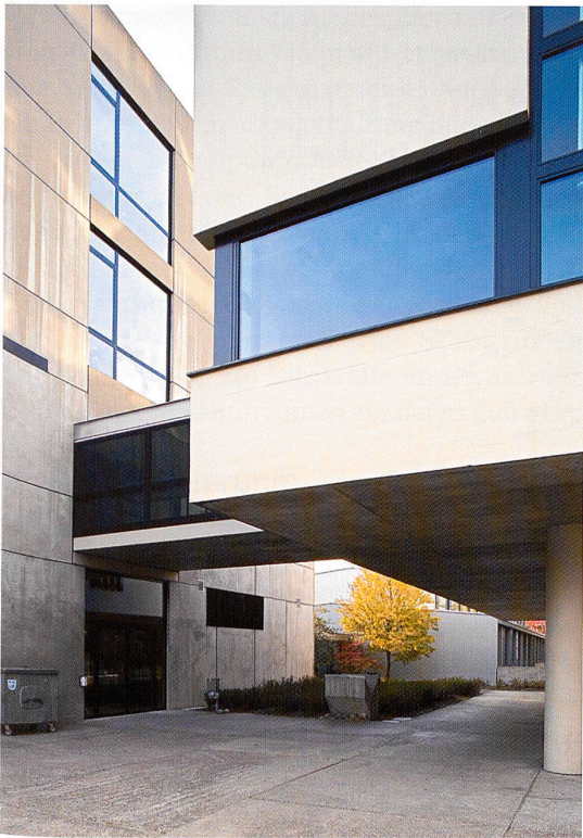
Bausünde: in den 80er Jahren überstrichene Fassade der Aula (rechts)

(geb. 1920) wirken prägend und begründen den Ruf der Kunstgewerbeschule weit über die Landesgrenzen hinaus.