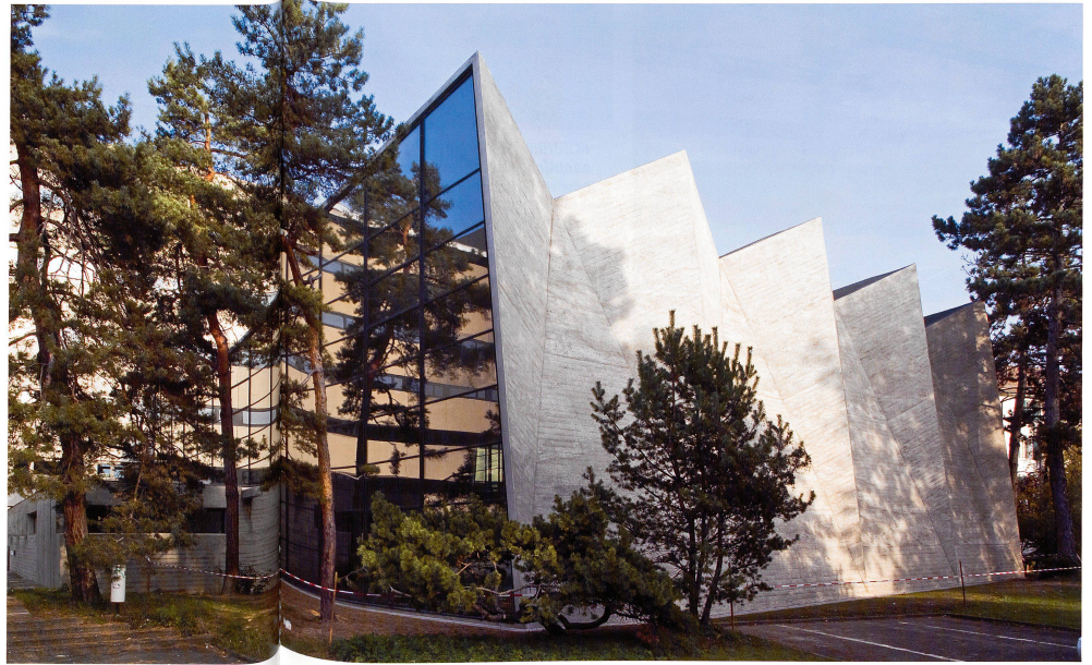
Maurerhalle: das lebendige Erscheinungsbild des Ortbetons wurde wiederhergestellt