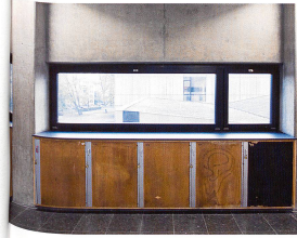
Neue Fenster: die Verbesserung der Energieeffizienz als wichtiges Anliegen

Les racines de ces deux institutions remontent à 1782: dans le quartier de Klingental à Petit-Bâle se trouvait autrefois une école qui enseignait la géométrie et le dessin aux jeunes artisans. Des efforts politiques conduisirent à la fondation de l'École professionnelle publique en 1886.