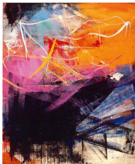
Hugo Weber, Amour Passion , 1963, huile sur toile, 151 x 127 cm, succession H. Weber/G. Lutz. © succession Hugo Weber

La peinture abstraite en Suisse 1950–1965 Musée d'art du Valais, Sion, du 14 novembre 2009 au 11 avril 2010 www.musees-valais.ch