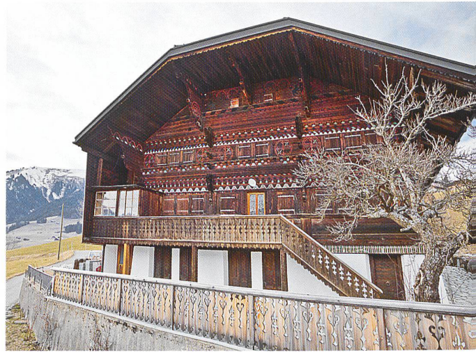
Château-d'Œx: L'Isatte, 1730, façade sud

Traditionnellement dans les régions de montagne, les toits adoptent une pente faible, permettant une couverture sans clous vu que le fer était rare et cher. Il fallait tirer parti des matériaux locaux: une fois le lattage chevillé sur les chevrons, on disposait côte à côte les anseilles, planchettes de bois d'environ 60 cm de long. Pour que le vent