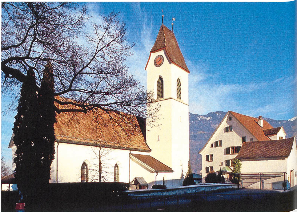
Sevelen Kirche