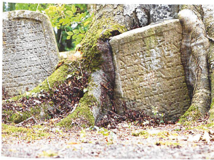
Endingen-Lengnau → 4