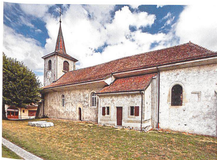
Assens → 23