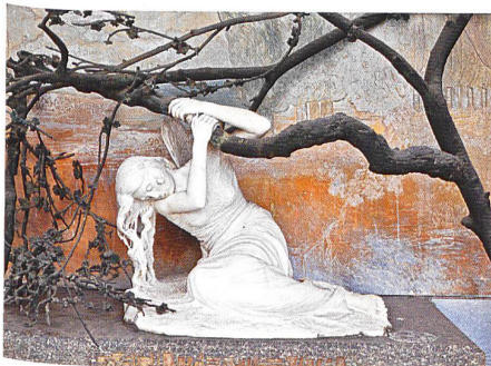
Lugano → 36