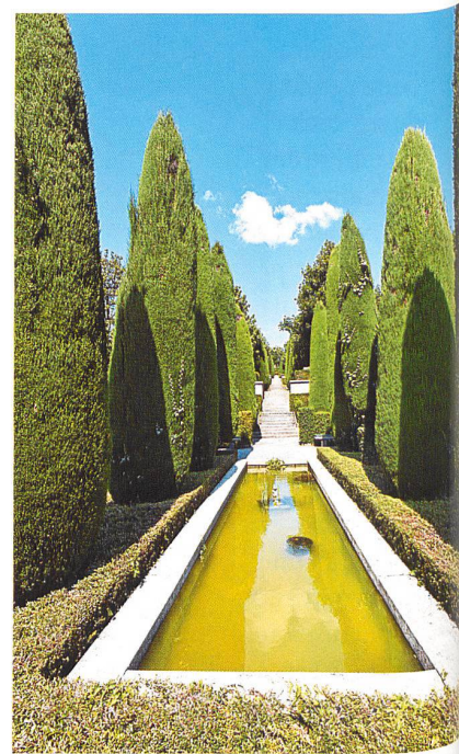
Lausanne, Bois-de-Vaux : jeux formels, végétaux et aquatiques du cimetière dessiné par Alphonse Laverrière

de Montoie, inauguré en 1909. Plusieurs raisons ont favorisé le retour à cette pratique antique : outre les facteurs hygiéniques, la rationalisation du séjour des morts dans les cimetières – de plus en plus court – ainsi que celle de l'espace qui leur est alloué apparaissent comme des éléments non négligeables. Dans le chef-lieu vaudois, en pleine expansion, c'est le cimetière de Montoie, ouvert en 1865, qui devient le principal lieu d'inhumation. Avant son agrandissement dans les années 1920, la crémation permet de gagner de la place, un corps réduit en cendres occupant bien moins d'espace qu'un corps inhumé dans un cercueil. On peut parler d'une véritable « industrialisation » de la mort ; avec l'essor démographique considérable des XIX e et XX e siècles, il n'est d'ailleurs pas un domaine rattaché à la vie et à la mort des citoyens (naissance, hôpitaux, cimetières) qui n'échappe à une gestion réglée et mécanisée.