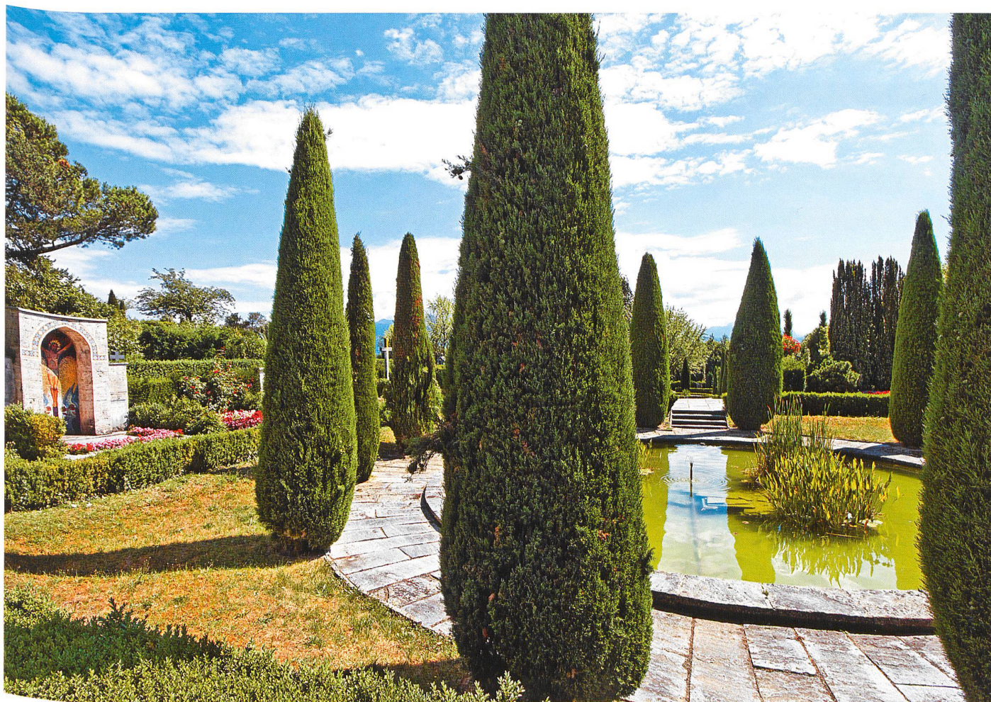
Lausanne, Bois-de-Vaux : près d'un bassin entouré de cyprès, l'un des rares tombeaux monumentaux, décoré d'une crucifixion en mosaïque