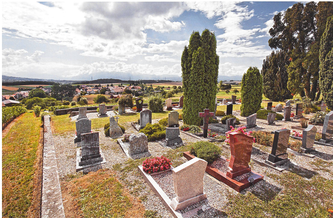
Aclens, cimetière. Muret, végétation sempervirent, alignement strict des concessions comme caractéristiques principales du cimetière protestant

par exemple, surplombe le village et ses alentours, nourrissant par la beauté de son panorama le romantisme d'un lieu qui invite au recueillement.