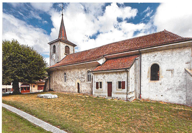
Le temple d'Assens est toujours cerné par le terrain désaffecté de son ancien cimetière