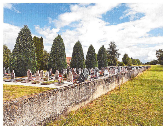
Assens, le cimetière mixte