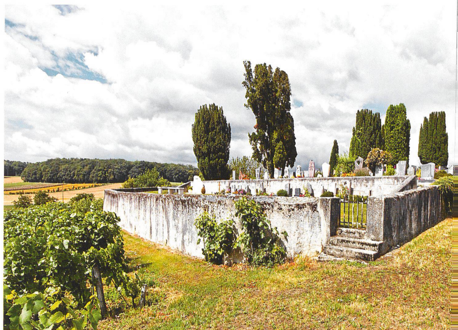
Aclens, le cimetière paroissial surplombant le village