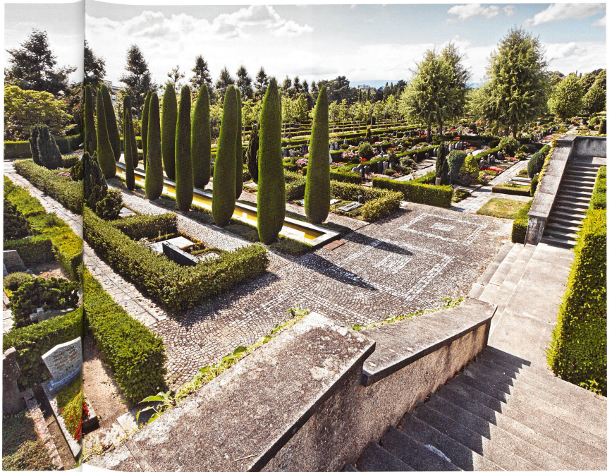
Lausanne, Bois-de-Vaux: la puissance d'un ordonnancement urbain pour un cimetière de 40 000 emplacements

ce Conseil « ne s'est pas aperçu que le voisinage des cimetières ait eu des influences dangereuses pour personne, ni qu'il ait répandu des exhalaisons qui aient été accompagnées de quelques mauvais effets ». 2 Entre l'hygiénisme naissant qui saisit alors les instances politiques en Europe – une loi de 1765 interdit les cimetières urbains à Paris – et sa concrétisation sur le terrain, près d'un siècle passera. Déplacer un cimetière est une démarche complexe, coûteuse et symboliquement difficile à accepter pour la population à qui l'on ►