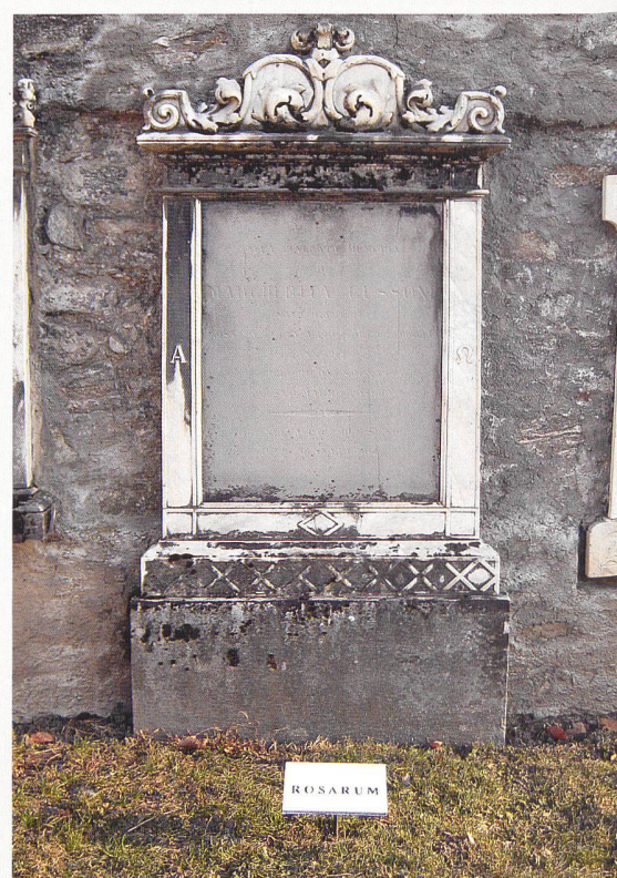
Cimitero di Rossura (vedi p. 30-31)

Direi che come minimo ha suscitato curiosità e ha indirizzato gli sguardi su una parte del cimitero a cui prima non si prestava molta attenzione. Da lontano la disposizione lineare delle tavolette crea l'effetto di una sottolinea-