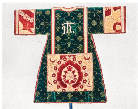
Dalmatik → 36