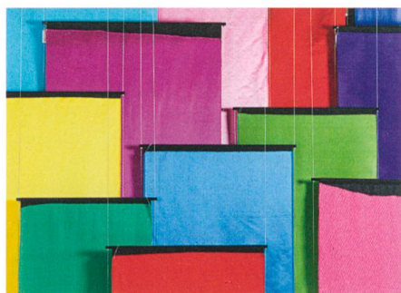
Satin double face → 6