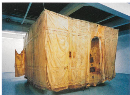
Hautraum → 27