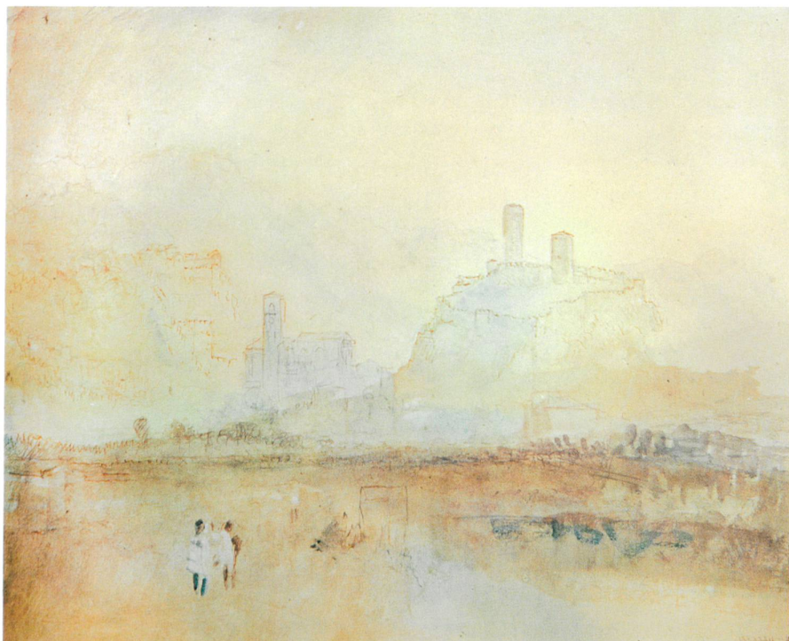
III. 2 J. M. W. Turner, Bellinzona da Nord, 1842 ca., acquarello, 22,9 x 28,6 cm, Londra, Tate Gallery (Turner Bequest).

o ancora l'attenzione che si deve prestare alle luce («Quand on veut dessiner il faut absolument observer les illuminations du matin et du soir»).