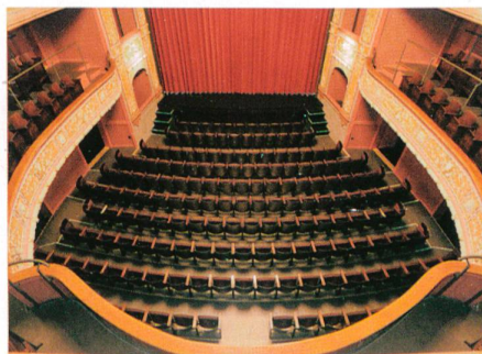
La Chaux-de-Fonds → 22