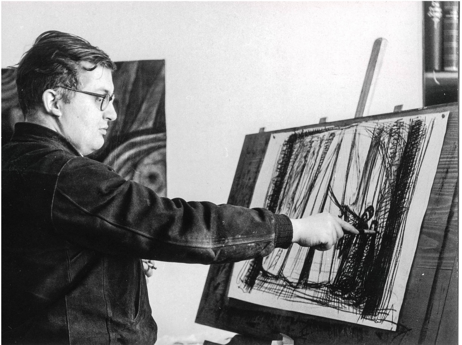
Abb. 1 Friedrich Dürrenmatt malt in seinem Atelier das Bühnenbild «Ein Engel kommt nach Babylon» (1948).

Wie sich das Kopftheater Friedrich Dürrenmatts und die Denkspiele Franz Kafkas wieder dem frühantiken Auftritt des Theaters annähern: ein Versuch über die Originalität und die Intuition zweier Künstler, die schreibend und auch zeichnend selber zu Theaterdirektoren und Chorführern wurden.