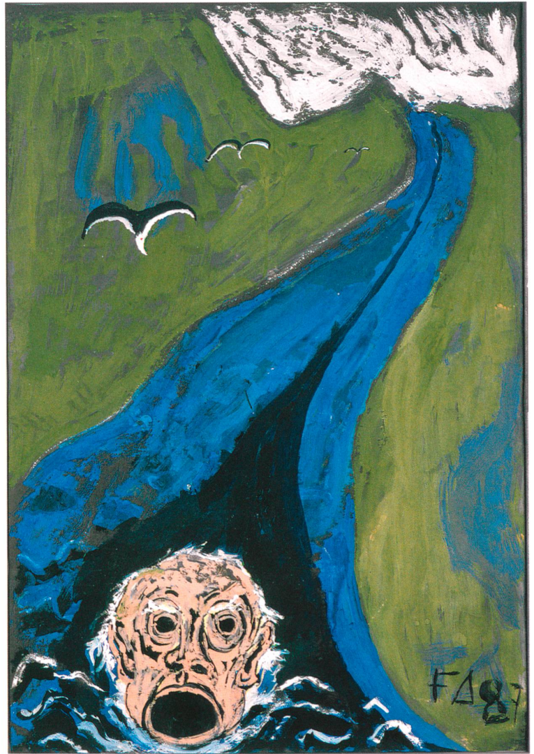
Abb. 7 Friedrich Dürrenmatt. Der singende Kopf des Orpheus treibt den Styx hinunter, 1987. Gouache, 99 x 70 cm. Centre Dürrenmatt Neuchâtel

Zeichnen, Schreiben und Malen werden auch bei Dürrenmatt unterschiedslos aufgegriffen: «Ich male aus dem gleichen Grund wie ich schreibe: weil ich denke.» 9 Dürrenmatt will seine graphischen Werke nicht als Nebenarbeiten zu seinen literarischen Stücken verstanden sehen. Sie kämen vielmehr jenen Schlachtfeldern gleich, «... auf denen sich meine schriftstellerischen Kämpfe, Abenteuer, Experimente und Niederlagen abspielen». Weil sie ebenso Schauspiel sind wie die schriftlich verfassten Schauspiele, nennt er sie dramaturgisch – «wie ich drauflos zeichne, schreibe ich drauflos». 10 Damit bleibt Dürrenmatt «nichts anderes übrig, als sich dahintreiben zu lassen» im Gedankenstrom aus Erinnern und Vergessen und Vergessenmüssen, damit man weitermachen kann. Dürrenmatts Kopf ist die Maske des Ursängers (siehe Abb. 7). Das Behaupten neuer Einfälle hält an. Beständig werden Ausführungen gemacht und neue Rollen verteilt. Der Autor ist in (Schreib-)Fluss geraten. Seine unendlichen Aufzeichnungen sind strudelnde Gesänge des Orpheus, dessen Mund niemals verstummt, weil die (Aus-)Sage dahinströmt – denn «einmal geschrieben, macht sich das Geschriebene selbständig, verbindet sich mit den Vorstellungen des Publikums, noch schlimmer, mit jenen der Kritiker, die wiederum das Publikum beeinflussen». Dürrenmatts «Vorwort zum Nachwort» von