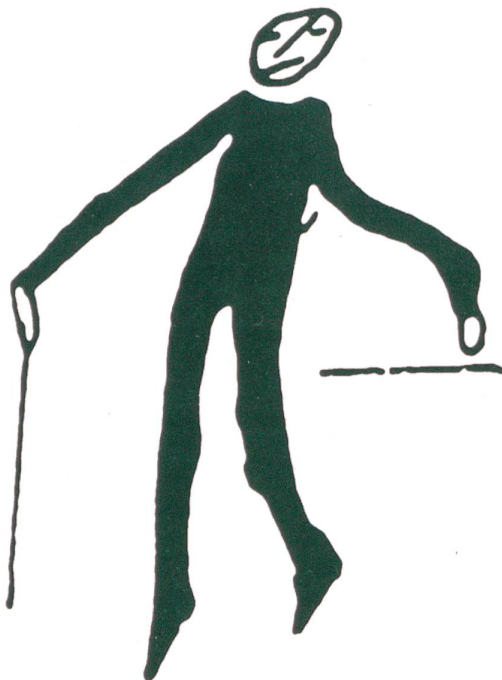
Abb. 6. Die Zeichnungen 3–6 stammen von Franz Kafka, ohne Titel und ohne Datum. Tinte (?), zwischen 1911 und 1922 entstanden. Format unbekannt (Standort vermutlich Archiv Max Brod, Tel Aviv)