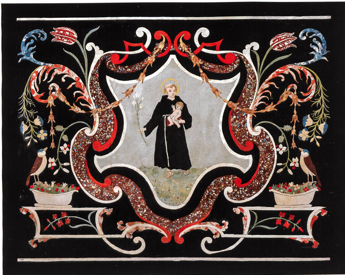
Comologno, chiesa parrocchiale di San Giovanni Decollato. Altare di Sant'Antonio di Padova. Lastra centrale del paliotto firmato «Giuseppe Maria Pancaldi Fece 1774»