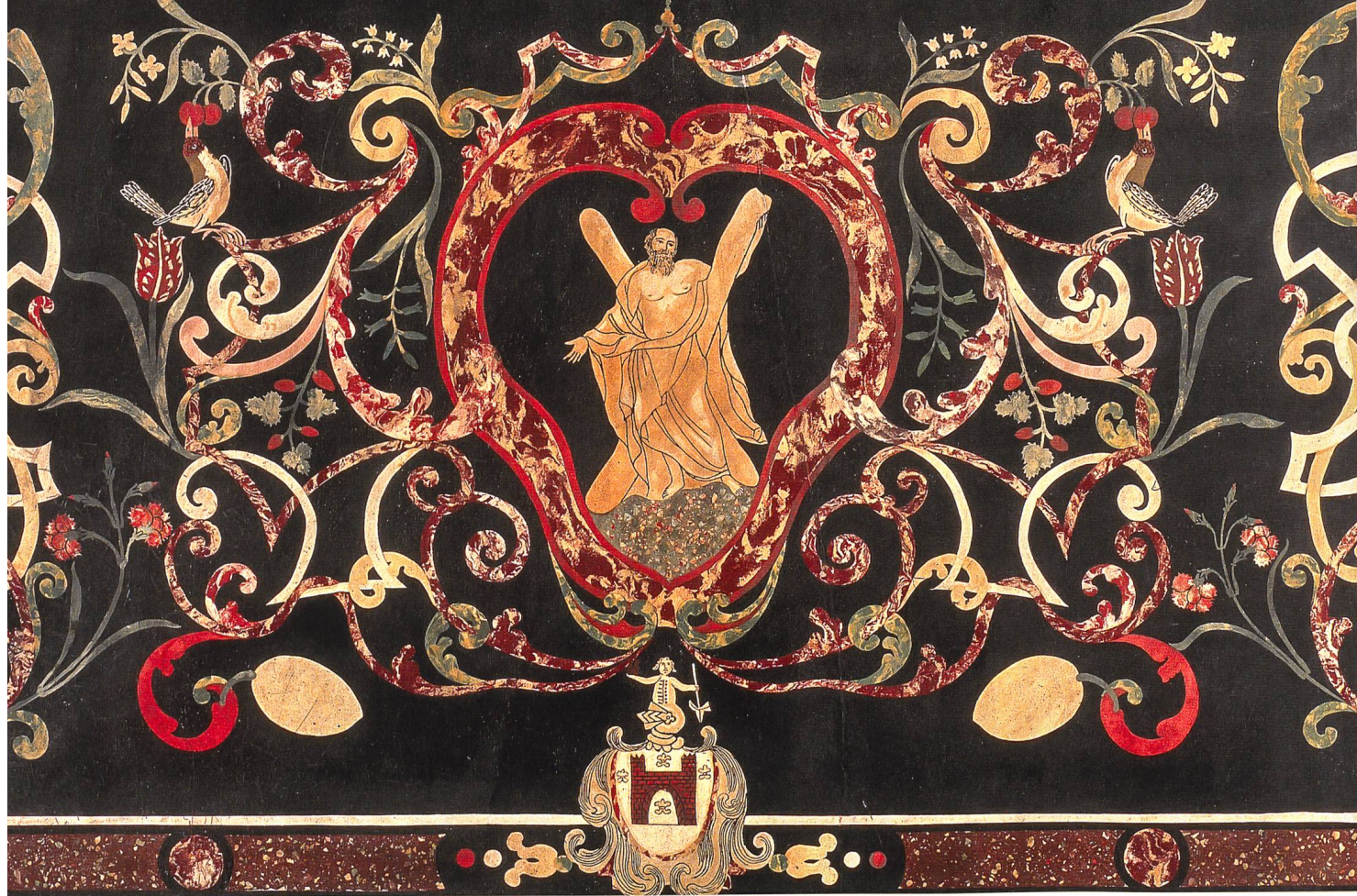
Muralto, chiesa collegiata di San Vittore. Già altare di Sant'Andrea. Parte centrale del paliotto attribuito alla bottega dei Pancaldi, ante 1741. In basso, lo stemma dei Muralti, justratoni dell'altare