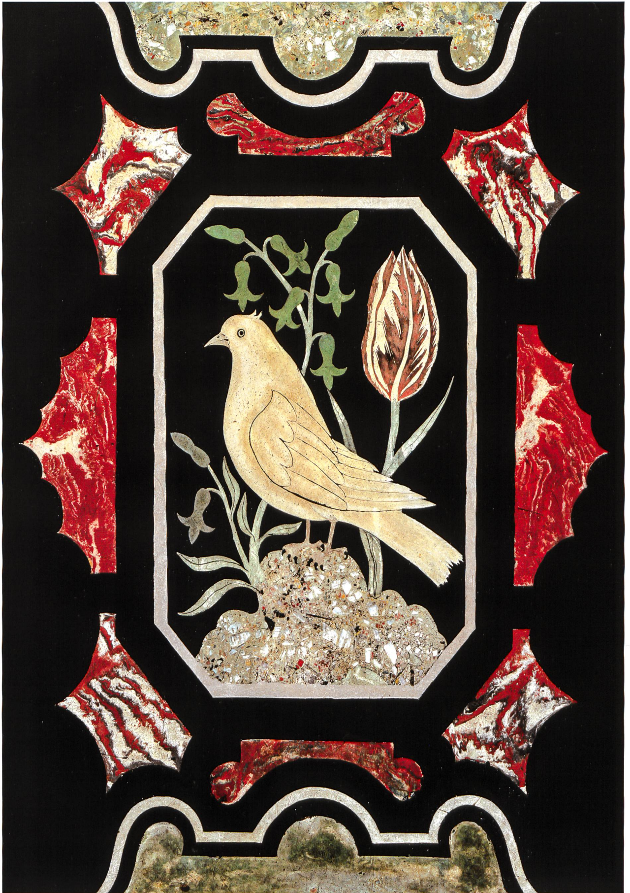
Lugano, chiesa di Santa Maria degli Angeli. Altare maggiore. Particolare della lastra destra del paliotto probabilmente della bottega intelvese di Pietro Solari, inizio XVIII secolo