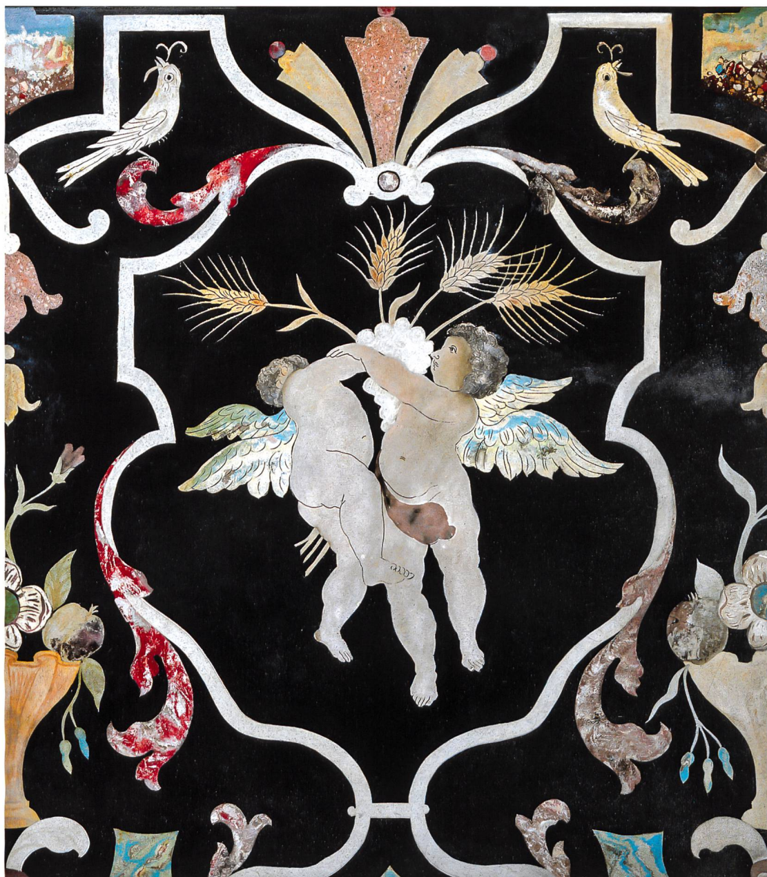
Mosogno, chiesa parrocchiale di San Bernardo. Altare laterale. Particolare di una lastra centrale recuperata di un paliotto attribuito a Francesco Solari, 1730 circa

economici; infatti non è lontano il desiderio di meravigliare, di sorprendere il profano con una perfetta imitatio , e questo in due sensi: imitare da un lato «solamente» opere marmoree nelle più incredibili sfaccettature e dall'altro rendere con materiali illusionistici le bellezze della natura espresse mediante impasti artificiali, e non dipinti, soprattutto nel ricchissimo vocabolario floreale e faunistico riscontrabile sulle lastre. L'idea dell'inganno, dell'illusione tecnica e cromatica ha da sempre affascinato l'occhio e, nel caso specifico di superfici in scagliola, perfettamente lisce (e quindi non ruvide come sono gli intarsi reali di pietra) anche il senso tattile dell'uomo.