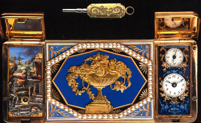
Tabakdose mit Uhr und Automat, Genf um 1790. Gehäuse aus Gold, fein graviert und emailliert, dreiteiliger Deckel mit Halbperlen besetzt. Links Automatenzene «Amors Schmiede». Abmessung: 80 × 35 × 15 mm.