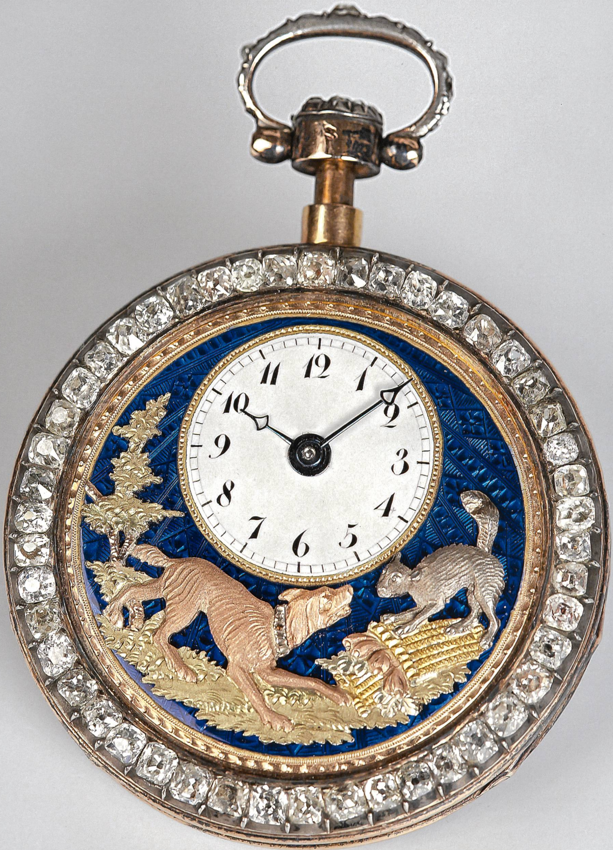
Goldene Taschenuhr mit Viertelstundenrepetition. Feinstes Email auf der Rückseite, am Rand mit Diamanten besetzt. Auf Knopfdruck werden die Stunden und Viertelstunden akustisch angegeben durch Bellen des Hundes, die Katze wedelt dazu mit dem Schwanz. Piguët & Meylan in Genf zugeschrieben, um 1820. Durchmesser der Uhr: 40 mm. Inv. 4067.