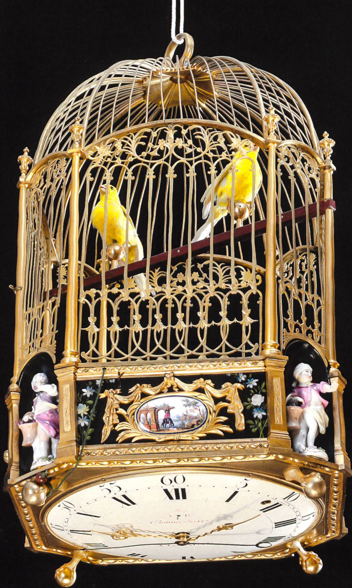
Grosser Singvogelkäfig, Pierre Jaquet-Droz und Henri Maillardet zugeschrieben, La Chaux-de-Fonds um 1780. Zwei ausgestopfte Kanarienvögel singen, drehen sich, bewegen den Schnabel und schlagen mit den Flügeln. Emaillierte Kartuschen an den Seiten, Landschaftsszenen darstellend, kleine Porzellanfiguren aus Meissen an den Ecken, Uhr mit Sekundenzeiger aus der Mitte am unteren Boden. Signatur des Händlers «Bonna Frères à Genève» auf dem Zifferblatt, ca. 60 cm hoch. Inv. 1452.

Andere, lebensgrosse Automaten begeistern durch die Natürlichkeit ihrer Bewegungen, allen voran natürlich die Androiden, aber auch die grossen Vogelkäfige, über die Jakob Auch schreibt: «Droz, der Sohn, verfertigte auch mehrere Kanarienvögel, die in Käfigen herumspringen, und verschiedene Stückchen pfffen, mit der natürlichen Bewegung des Schnabels, der Kehle und des ganzen Leibes. Eine beträchtliche Anzahl davon verkaufte er an den türkischen Grosssultan.» 2