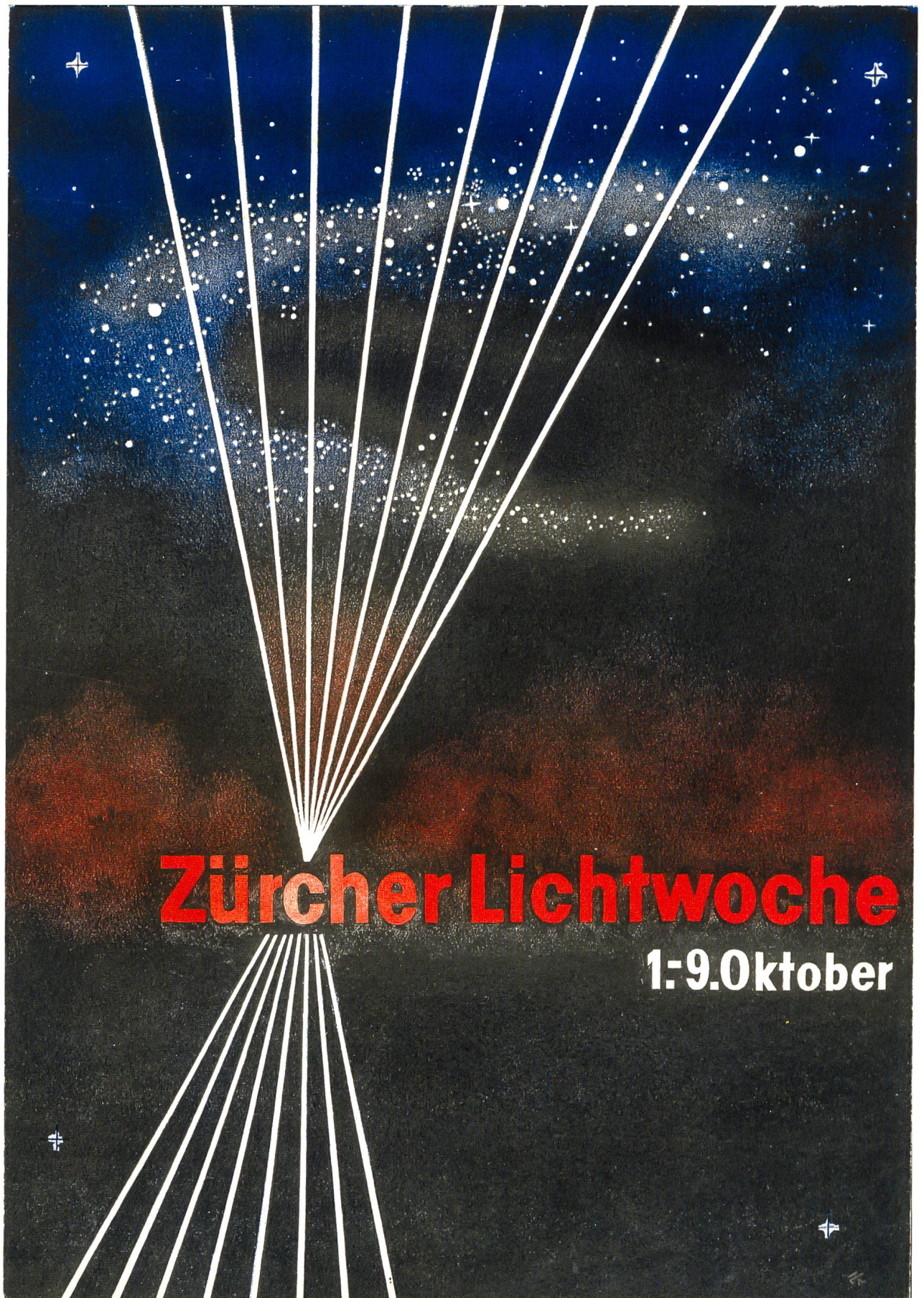
Zürcher Lichtwoche 1932. Plakatgestaltung Anton Stankowski. © Archiv Stankowski-Stiftung Stuttgart