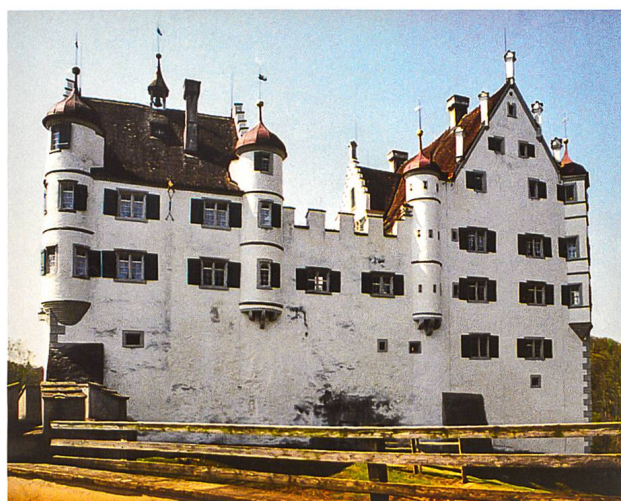
Schloss Weinstein in Marbach.