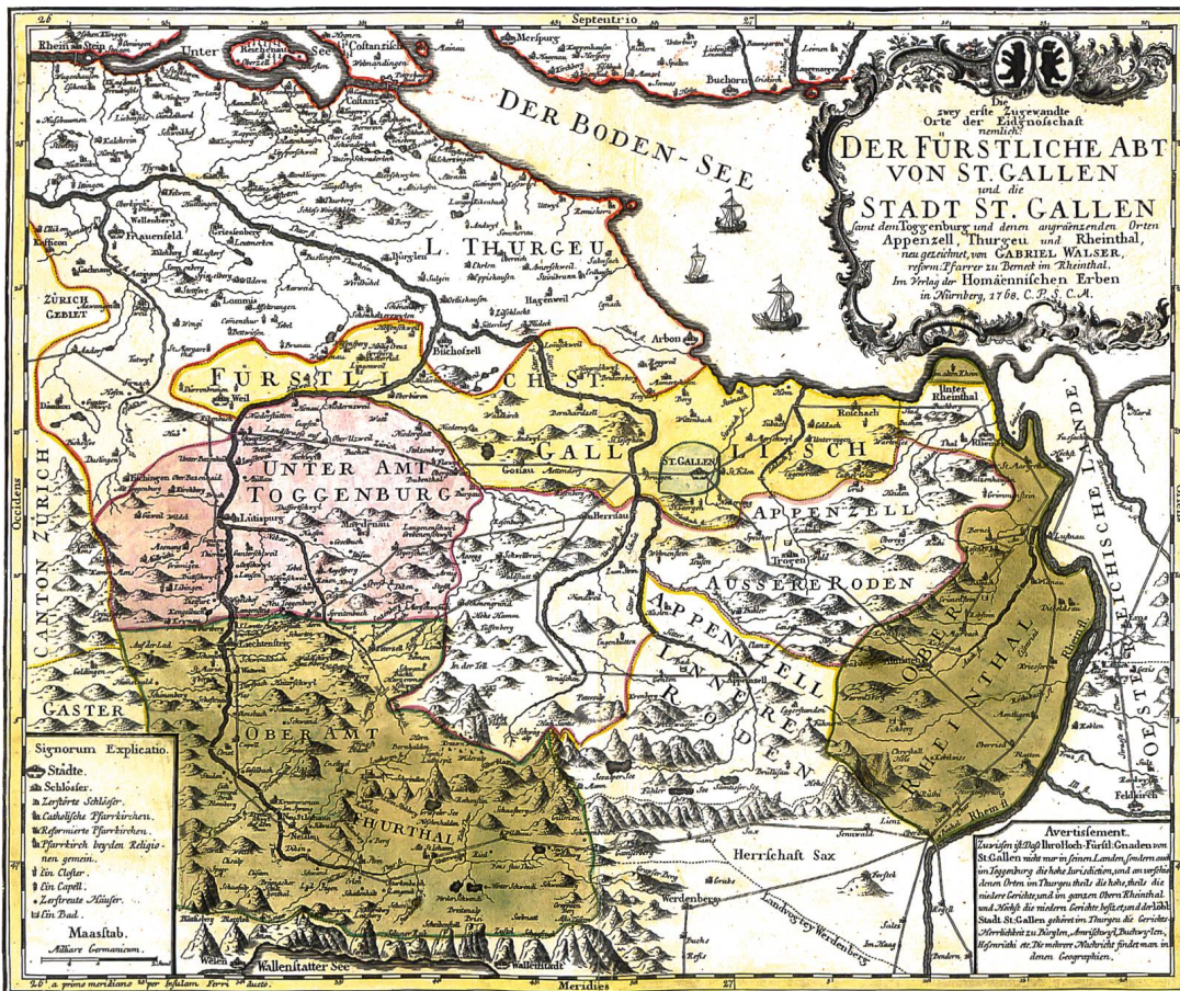
Karte des Gebiets der Abtei St. Gallen von Gabriel Walser, 1768. Das kleine Hoheitsgebiet der Stadt St. Gallen ist grün unterlegt

tal. Dieses St. Galler Beispiel ist insofern von überregionalem Interesse, als es zeigt, dass eine Stadt auch ohne nennenswertes Territorium in der Lage war, ihre Interessen im Umland durchzusetzen. Das stadt-sankt-gallische Hoheitsgebiet umfasste nämlich nur ca. vier Quadratkilometer, nämlich 2,5 in ost westlicher und 1,5 Kilometer in nord südlicher Richtung. Die Dörfer und die Landschaft in der Umgebung gehörten weitgehend zum Territorium der Fürstabtei St. Gallen.