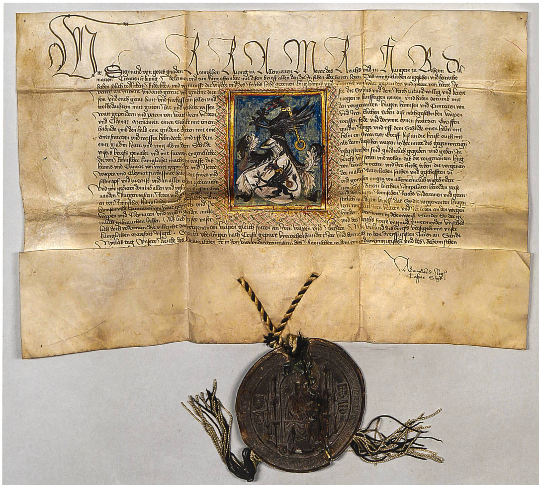
Der vermögende Kaufmann Hug von Watt, ein direkter Vorfahre von Vadian, liess seiner Familie im Jahr 1430 von König Sigismund einen Wappenbrief ausstellen. Hug von Watt war der Gründer der ersten grossen St. Galler Handelsfirma, der Diesbach-Watt-Gesellschaft. Diese etwa zwischen 1420 und 1460 tätige Firma – eine geschäftliche Verbindung der Berner Familie Diesbach und der St. Galler Familie von Watt – war die grösste und bedeutendste der damaligen Eidge nossenschaft

schen den sozial sehr unterschiedlich situierten Schlossherren und der ansässigen Bevölkerung zusätzlich. So ist es nicht erstaunlich, dass im Zuge dieses adlig gefärbten Lebensstils weitere Konflikte entstanden. Zum Beispiel hätten die Zollikofer an zwei Hochzeitsmählern auf einem ihrer Schlösser bis elf Uhr nachts mit lauten Trompetenklängen musiziert, und ebenso würden sie mit ihrem Vogelherd – einer Vorrichtung zum Einfangen von Vögeln – sonntags Scharen von Kindern anziehen und diese damit vom Gottesdienstbesuch abhalten. Hier zeigt sich ein weiterer Graben zwischen der ansässigen Landbevölkerung und den zugezogenen Städtern: der konfessionelle Unterschied zwischen den reformierten St. Gallern und den katholischen Rheintalern. Auch der ökonomische Aspekt kann nicht ausser Acht gelassen werden. Die grosse Kapitalkraft von Stadtbürgern trieb nämlich allgemein die Verkaufspreise in die Höhe. Die Rheintaler klagten, dass der Wert der Güter dermassen steige, dass der einheimische «Bauersmann sie nie mehr zu kaufen vermöge». 10