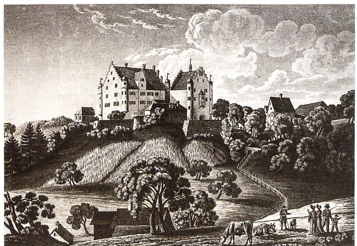
Das Schloss Altenklingen in Märstetten TG befindet sich heute noch im Besitz der Familie Zollikofer.