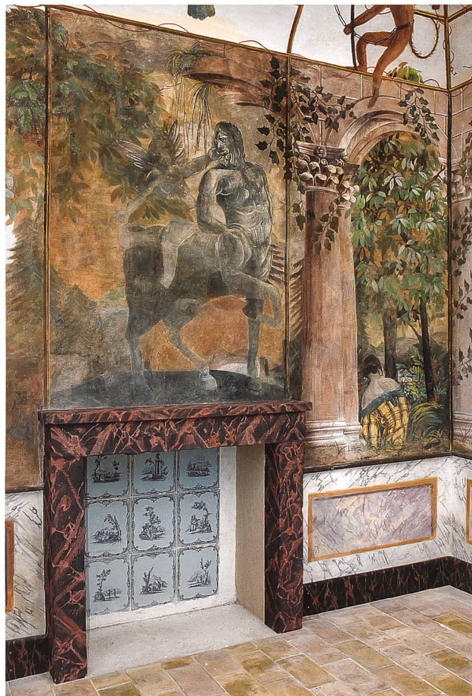
10 Fig. 10 Pavillon des Bugnons, paroi nord-ouest. Jeune femme assise au pied de ruines antiques et centaure chevauché par un amour, copie d'un groupe statuaire célèbre

constitués de panneaux de marbre, une petite latte de bois délimitant cette zone d'appui. La représentation de cette structure légère permet d'abolir les limites de l'architecture et offre le prétexte d'une véritable ouverture sur un paysage extérieur imaginaire et idéalisé, évoquant ici tour à tour les pays lointains, l'Arcadie et l'Antiquité. Perchés sur les éléments métalliques horizontaux, divers oiseaux exotiques côtoient des singes aux faciès étrangement humains (fig. 9). Le décor du plafond voûté suggère le ciel et ses nuées sur lesquelles repose une Diane chasserresse. Le modèle de cette figure mythologique est un groupe statuaire célèbre de l'art de la Renaissance française, la Diane d'Anet (fig. 11). Au-dessus de la cheminée, un centaure chevauché par un amour emprunte ses traits à une statue antique, dont il existe une copie gravée par François Perrier 6 (fig. 10).