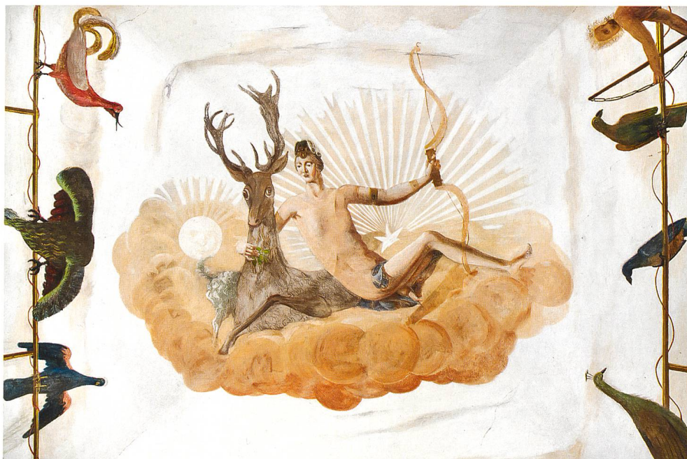
Fig. 11 Plafond voûté du pavillon des Bugnons. Sous un ciel baroquisant, évoquant le jour et la nuit, la représentation de Diane chasseresse prend pour modèle la statue de Diane du château d'Anet