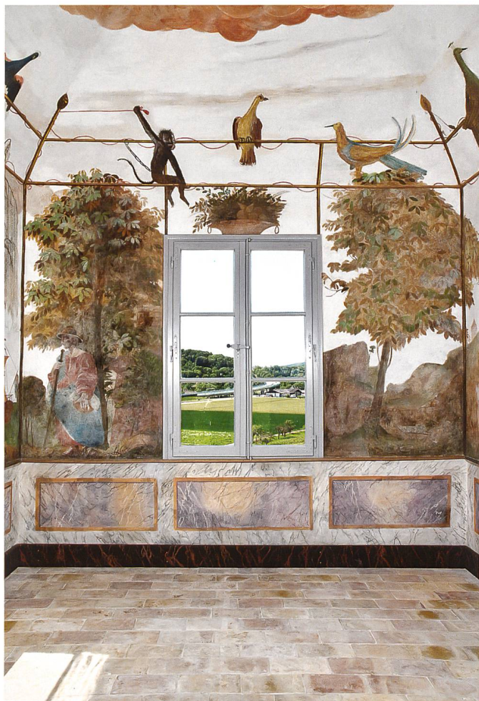
9 Fig. 9 Pavillon des Bugnons, paroi sud-ouest. Le décor après les restaurations de 2009, par l'Atelier Marc Stähli à Auvernier