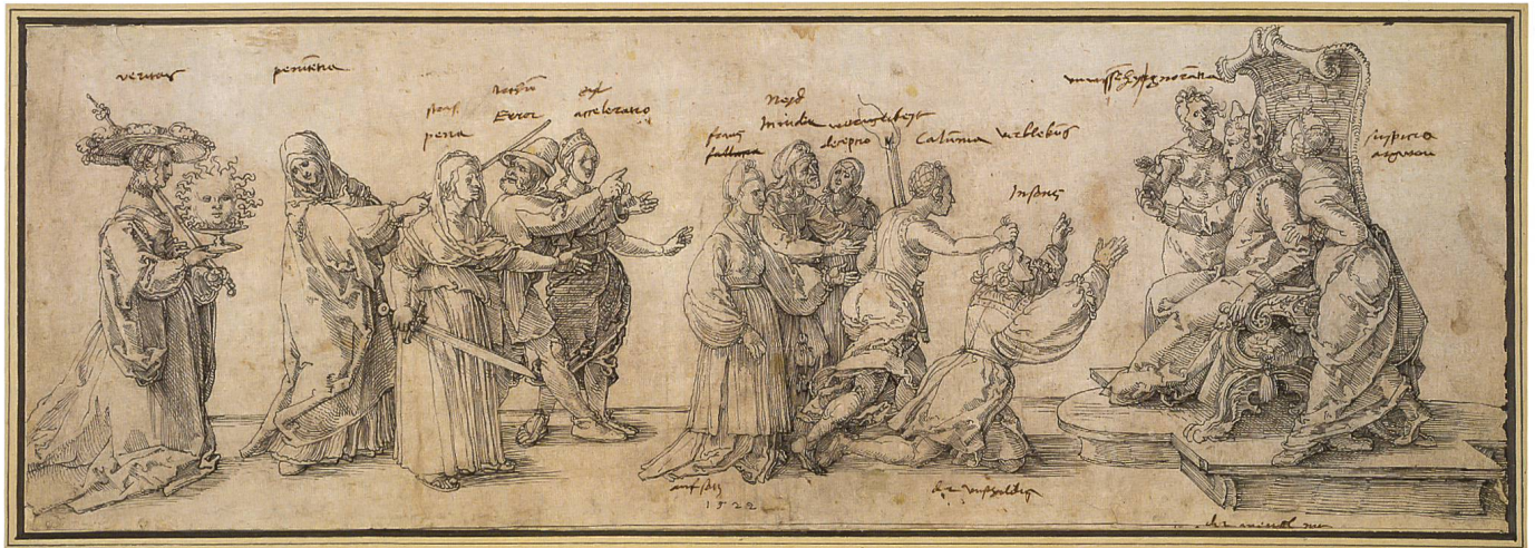
Abb. 5 Albrecht Dürer: «Die Verleumdung des Apelles». Entwurf für die Bemalung des Nürn- berger Ratssaales, 1521.