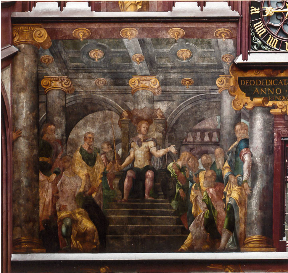
Abb. 8 Das «Urteil des Kambyses» an der Hofwand des vorderen Ratsstubenaus. Foto 2013.