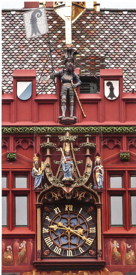
Abb. 2 Auf dem Baldachin der Rathausuhr stehen Figuren der Stadtpatrone Kaiser Heinrich II., seiner Gemahlin Kunigunde sowie die Muttergottes (die um 1608 in einem Akt reformatorischer Strenge in eine Justitia verwandelt wurde). Foto 2013.

1501 hatte der Rat die Boten der schweizerischen Eidgenossenschaft in Basel empfangen, um in ihrer Anwesenheit den Beitritt Basels zu ihrem Bund feierlich zu beschwören. Der Vertrag war auf Dauer ausgelegt, und so mag ein Gefühl des neuen Zeitalters geherrscht haben – wenn auch die Entscheidung weniger krass empfunden worden sein mag, als sie sich heute an der EU-Grenze im Dreiländereck darstellt. Die Eidgenossenschaft und Basel scherten schliesslich nicht aus dem Deutschen Reich aus, wie Reichsadler und Kaiserkrone auf Wappenscheiben in der Basler Ratsstube deutlich machen. Peter Habicht hat den Blick darauf gelenkt, dass der Basler Rat im Bewusstsein des neuen Bundes seine Beziehung zum Bischof als Stadtherrn neu zu definieren suchte. 1 Der Rat verweigerte 1502 dem Bischof den Schwur auf die «Handfeste» (verbriefte Ratswahlordnung), nicht prinzipiell, aber weil er in der Formel die neue Stellung wiederfinden wollte. 2 Der Konflikt konnte erst 1506 durch einen Kompromiss gelöst werden, und so ist man geneigt, das anspruchsvolle Bauwerk als Ausdruck des Strebens nach Selbständigkeit und Macht zu deuten.