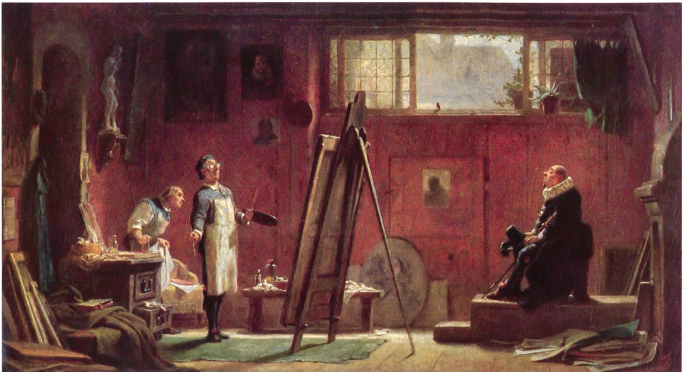
Carl Spitzweg: Der Porträtmaler (1852-55), Schweinfurt, Museum Georg Schäfer, Öl auf Leinwand, 22 × 40 cm

Das wohl aussergewöhnlichste Atelier schildert Keller aber nicht im Grünen Heinrich , sondern in der Rahmenerzählung zum Zyklus der Zürcher Novellen . Deren Hauptfigur, «Herr Jacques», ist ein junger Zürcher Bürger aus wohlhabender Familie. Nachdem er von seinem Jugendtraum Abstand nehmen musste, ein «Originalgenie» zu werden, betätigt er sich als Mäzen. Auf seiner Hochzeitsreise besucht er einen vielversprechenden jungen Bildhauer, der sein Studium mit einem Rom-Aufenthalt abschliessen wollte. Herr Jacques ist «auf ein bescheidenes, aber reinliches und feierlich stilles Atelier gefasst». Die Gebäude, in denen er es vermutet, scheinen einer Rom-Vedute entsprungen zu sein: «Eine ziemliche Wildnis und Wüstenei von Gemäuer, Holzplanken, alten Oelbäumen und Weinreben, wozwischen eine Menge Wäsche zum Trocknen aufgehängt war [...]. Die Thürpfosten bestanden aus zwei kolossalen bärtigen Atlanten, welche bis zum Nabel in der Erde steckten und eine quer gelegte mächtige Säulentrommel auf ihrem Genicke trugen; jedoch Kühlung gewährte ihnen bei dieser Arbeit das Dach einer niedrigen, aber weit verzweigten Pinie [...]» 6