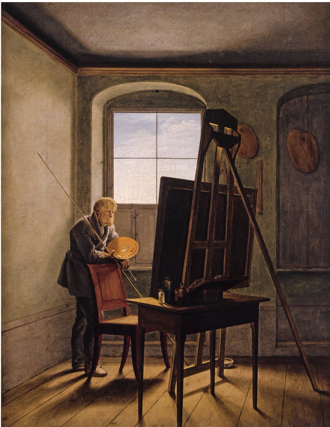
Georg Friedrich Kersting: Caspar David Friedrich in seinem Atelier (1812), Kunsthalle Hamburg, Öl auf Leinwand, 54 × 42 cm

Hinweis darauf, dass die Romantik aber doch noch nachwirkt, mutet es an, wenn Heinrich Lee, wie Kellers Titelheld mit seinem bürgerlichen Namen heisst, anfänglich bei einem Maler in die Lehre geht, der sein Atelier in einem aufgelösten Kloster untergebracht hat. Dieser Lehrmeister ist selbst noch dem alten Konzept verhaftet und lässt es geschehen, dass sich Heinrich bei seinen Naturstudien eher von der eigenen Phantasie als von den Naturgegenständen leiten lässt.