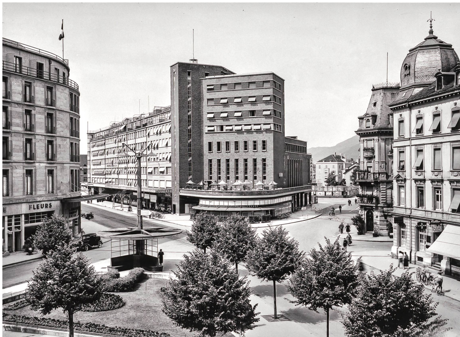
Biel, General-Guisan-Platz mit dem Volkshaus, erbaut 1930–1932 von Eduard Lanz. Juni 1934