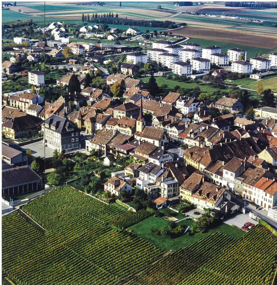
Cortailled, Luftaufnahme des Dorfs von Osten am 20.10.1980 aus einer Flughöhe von 120m.