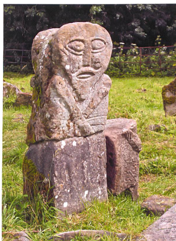
Steinfiguren auf Boa Island

mindestens 12, maximal 25 Personen Melden Sie sich für diese Reise mit dem Talon am Ende des Hefts an, per Telefon 031 308 38 38 oder per E-Mail an: gsk@gsk.ch