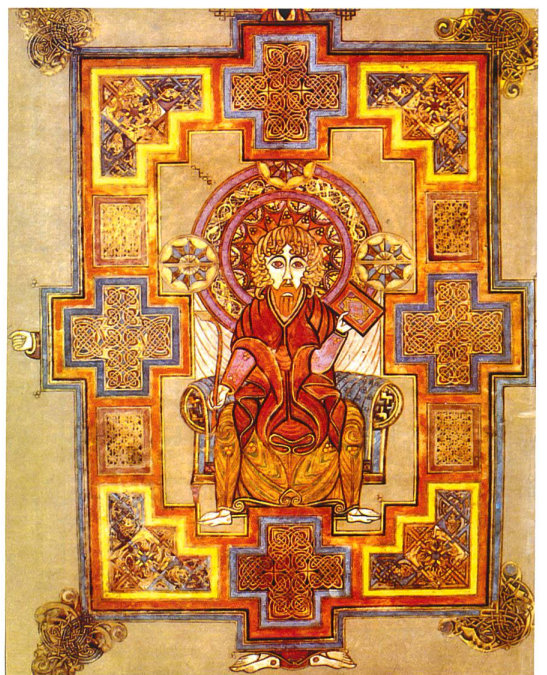
Book of Kells, Johannes