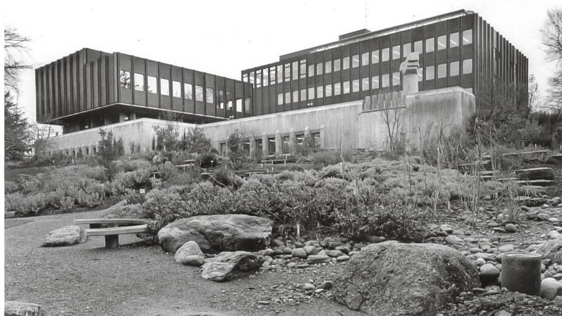
Hörsaaltrakt und Laborgebäude mit Aussichtsterrasse, Südansicht, 2016.