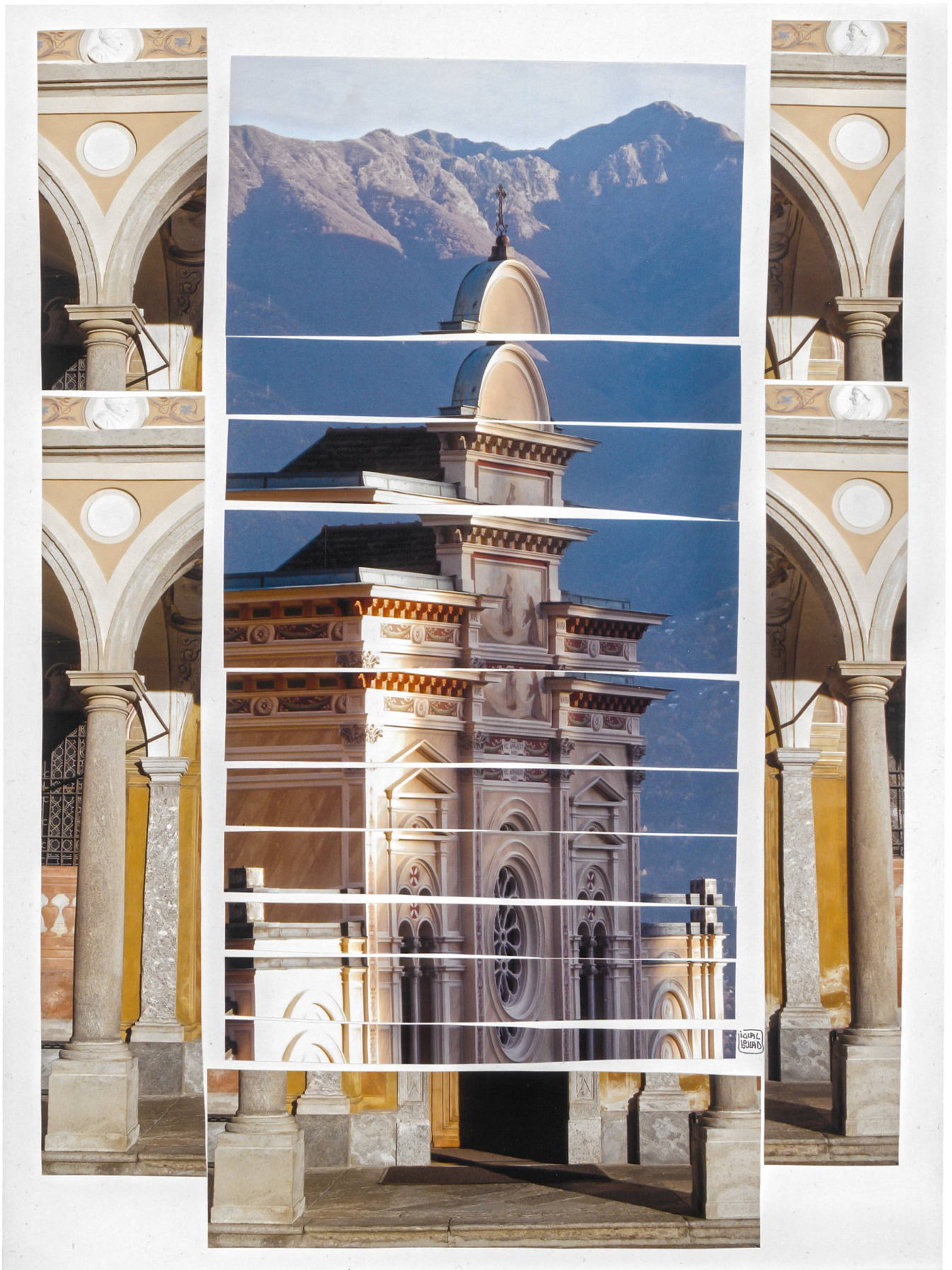
Madonna del Sasso Locarno