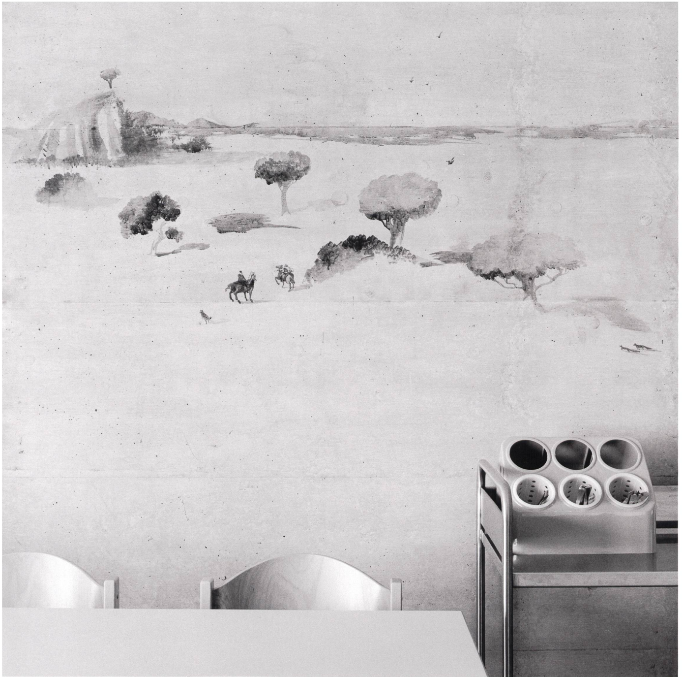
Strafanstalt Zug, Kantine, Wandzeichnung von Pavel Pepperstein, Ebene der Menschen und Tiere .