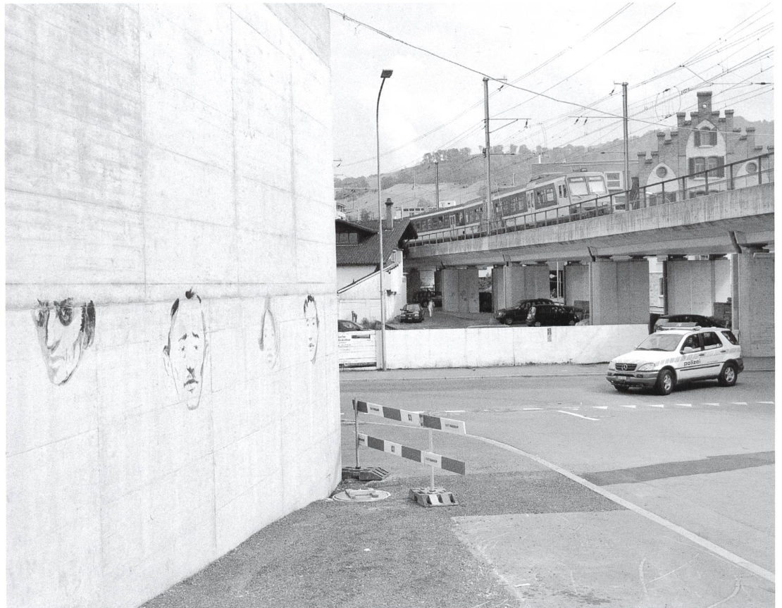
Strafanstalt Zug, Aussenwand des Gefängnisses gegen die Stadt mit Zeichnungen von Pavel Pepperstein, 2002.