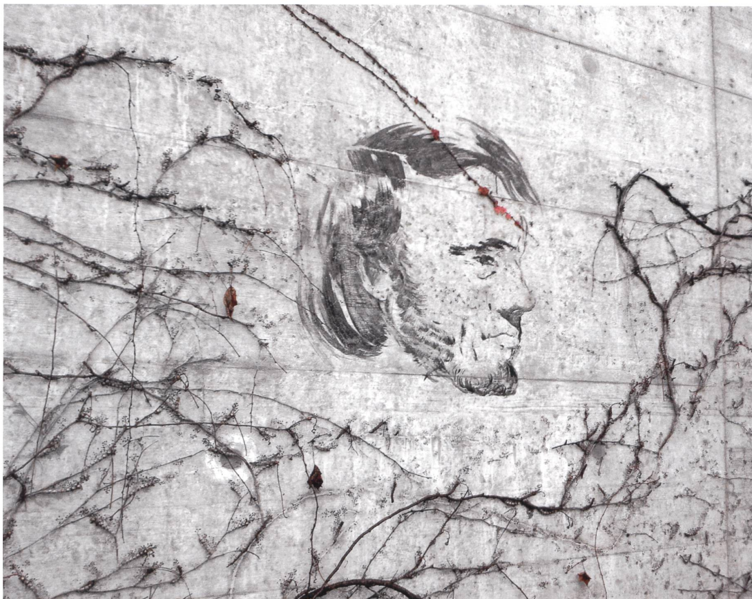
Strafanstalt Zug, Wandzeichnung von Pavel Pepperstein im dritten Geschoss, Sphäre der Götter.