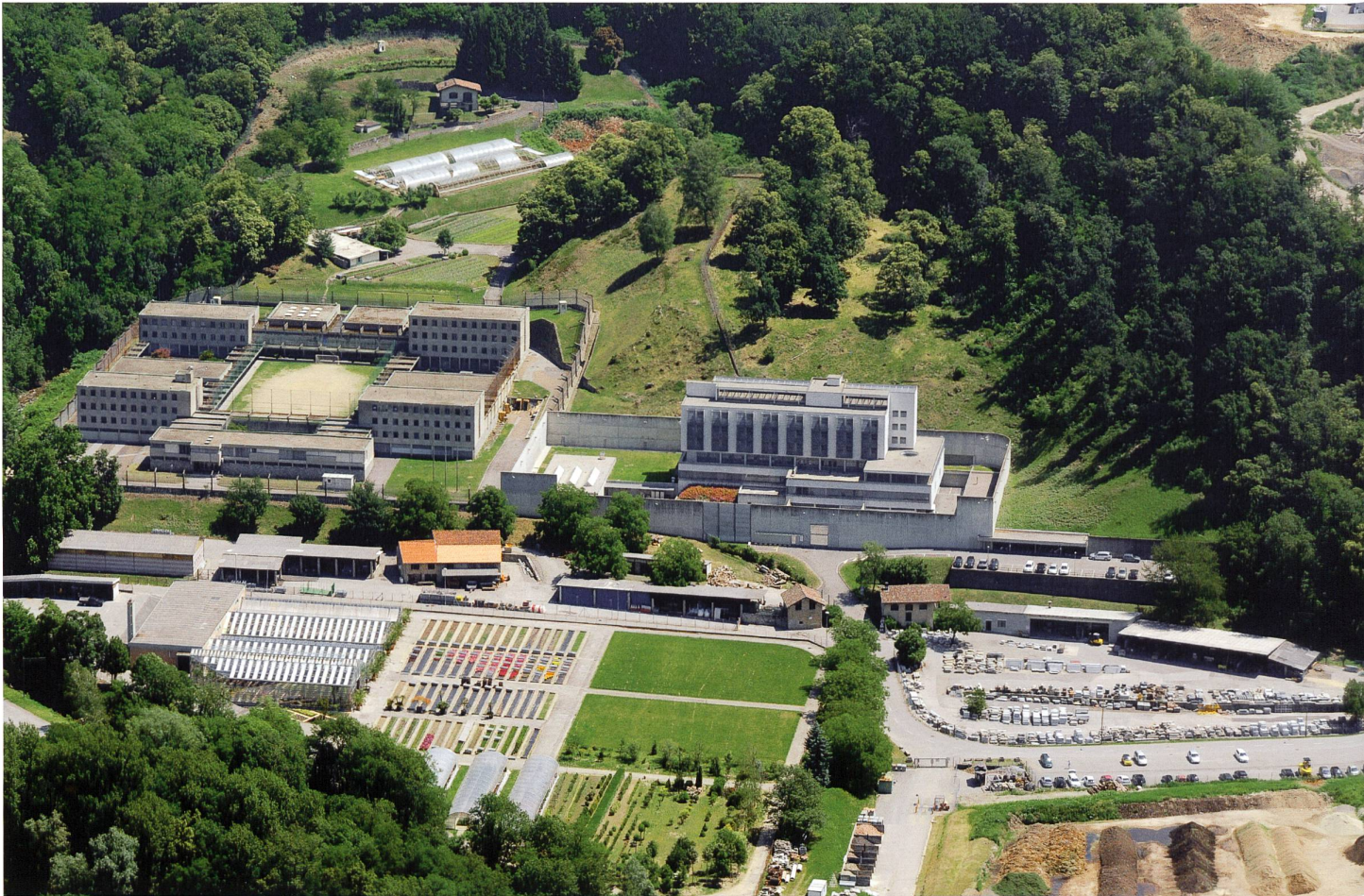
Penitenziario La Stampa (1968, a sinistra), la casetta La Silva sullo sfondo (usata come parlatorio riservato dal 1986), e il carcere giudiziario Farera, la prigione polifunzionale del Cantone (2007, a destra).

aperta, lo Stampino, in prigione per i detenuti in attesa di giudizio. La decisione del Gran Consiglio data al 1997. Tuttavia, il progetto di ristrutturazione presentato dal Governo, che contempla anche la risistemazione di una parte della Stampa e la creazione di servizi comuni per i due stabilimenti, incontra opposizioni tra i banchi del Parlamento che accorda unicamente il credito necessario per la creazione della prigione per la detenzione preventiva al posto della sezione aperta. Quest'ultima sarà trasferita a 400 m dal penitenziario in un edificio affittato dal Cantone. A seguito di ritardi importanti, la nuova prigione per la detenzione preventiva – il Carcere giudiziario La Farera, dal nome del luogo – viene aperta nel 2006. I 55 posti inizialmente previsti per la detenzione provvisoria non differenziata di uomini e donne 8 sono presto aumentati a 78, per giungere agli attuali 88 con l'introduzione di letti a castello.