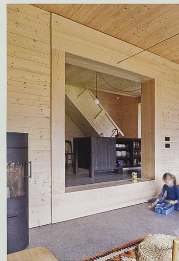
Fig. 3 Vue depuis le séjour de l'appartement du bas, en direction de la cuisine, matérialisée par un bloc aux multiples fonctions, laissant passer le regard au-dessous. Au fond, l'escalier-échelle, comme une citation des Smithson. Seul le sol du rez-de-chaussée fait exception à la règle du tout-bois ; il s'agit d'une chape polie.