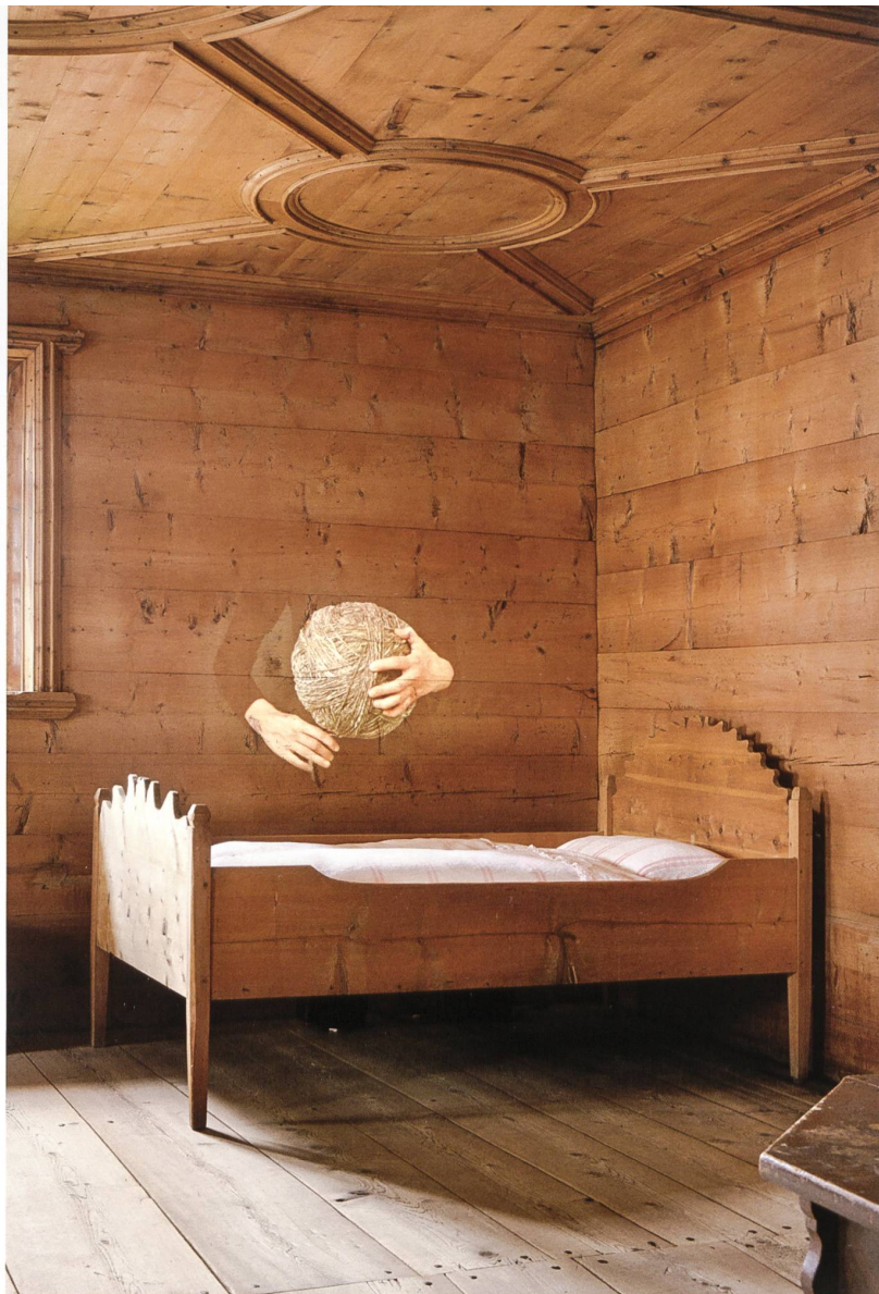
Video Arte Palazzo Castelmur 2013, Evelina Cajacob, Incrésciar – LangeZeit . HD-Videoinstallation. Bild: Margarit Lehmann, Ton: Martin Hofstetter. Foto Ralph Feiner. © 2017, Pro Litteris Zürich

dem Thema der Land and Environmental Art widmete. Alle zwei Jahre sollen nun Ausstellung und Akademie mit wechselndem thematischem Schwerpunkt im Safiental verankert werden. Im Sommer 2018 wird die Art Safiental zum zweiten Mal stattfinden.