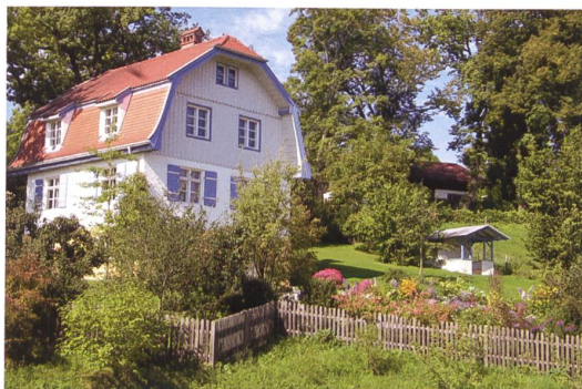
Das Russenhaus in Murnau. Foto z. V. g.

Von Zürich fahren Sie mit dem Bus zuerst nach Neuschwanstein, dem Märchenschloss des legendären Bayernkönigs Ludwig II. Am frühen Abend erreichen Sie Murnau. Das hübsche Städtchen präsentiert sich nicht nur als Kurort, sondern auch als Ort der Inspiration für das Schaffen vieler Künstler.