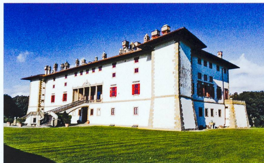
Die Villa «La Ferdinanda» in Artimino.

Melden Sie sich für diese Reise mit dem Talon am Ende des Hefts an, per Telefon 031 308 38 38 oder per E-Mail an: gsk@gsk.ch