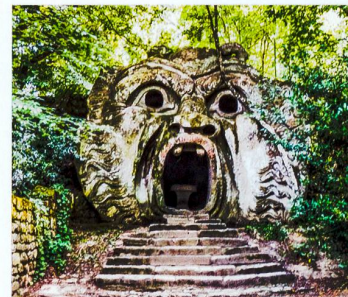
Ungeheuer Orco, Monsterpark Bomarzo.