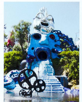
Tarotgarten von Niki de Saint Phalle.