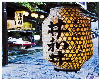
Abendstimmung bei Kyoto.

Melden Sie sich für diese Reise mit dem Talon am Ende des Hefts an, per Telefon 031 308 38 38 oder per E-Mail an: gsk@gsk.com