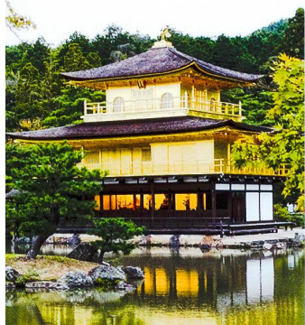
Kinkaku-ji, der goldene Tempel in Kyoto.