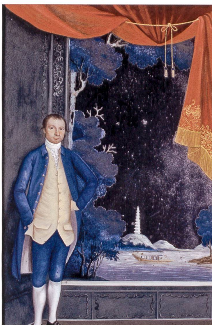
Fig. 5 Spoilum, Portrait de Thomas Fry. Miroir peint, 38 × 25,4 cm, cadre non connu. Au dos du tableau, inscription manuscrite : Drawn October the ... at Canton in China/ Spillem in the year 1774. Martyn Gregory Gallery