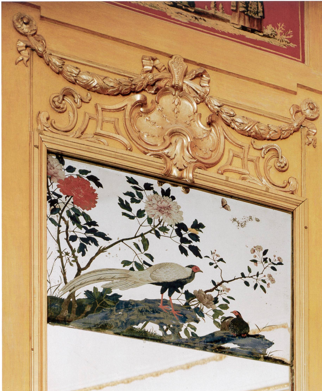
Fig. 1 Couple de faisans argentés et pivoines. Miroir peint, 80 × 60 cm, cadre : haut de trumeau en bois doré. Pavillon chinois du Palais de Drottningholm, Stockholm.

légendaire disent certains, celle de l'empereur Qianlong pour l'une de ses concubines, la belle princesse ouïghour Xiang Fei.