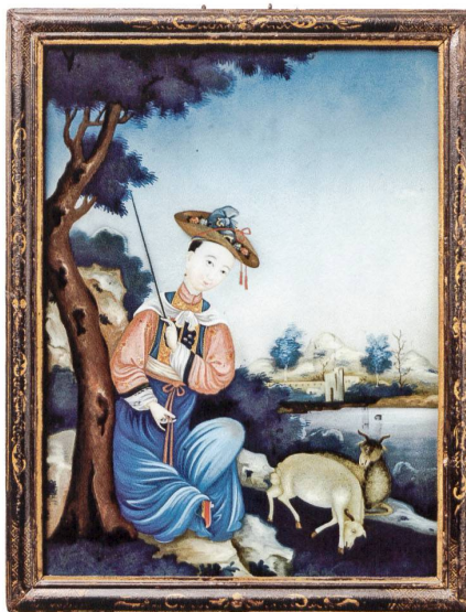
« Fig. 2 Scène d'extérieur : musicale au bord de l'eau. Élément d'une paire de miroirs peints, 80 × 51,3 cm, cadre en bois doré époque Louis XV.