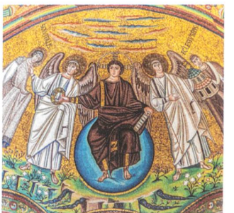
Mosaiken in San Vitale, Ravenna.