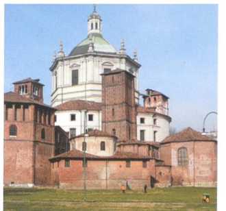
San Lorenzo Maggiore, Mailand.