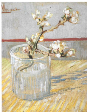
Mandelblüte von Vincent van Gogh.

Durch landschaftlich reizvolle Gegenden geht es zum Grand Canyon du Verdon. Den Weg säumt üppige Natur, darunter die legendären Olivenhaine, Wein und Lavendel. Kulturhistorischer Höhepunkt ist das Bergstädtchen Moustiers-Sainte-Marie mit seiner romanischen Kirche.