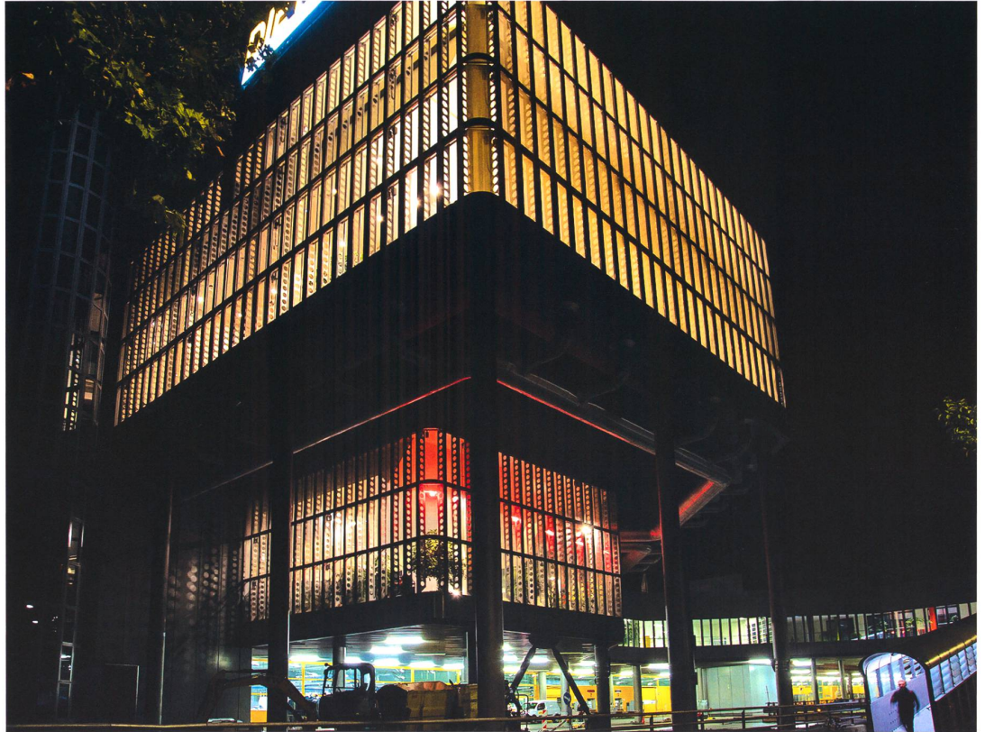
Das Postbetriebszentrum Zürich-Mülligen mit den roten Fibonaccizahlen und dem Eingang zur Fussgängerrampe. Foto Anne Gabriel-Jürgens. © 2020, ProLitteris, Zürich