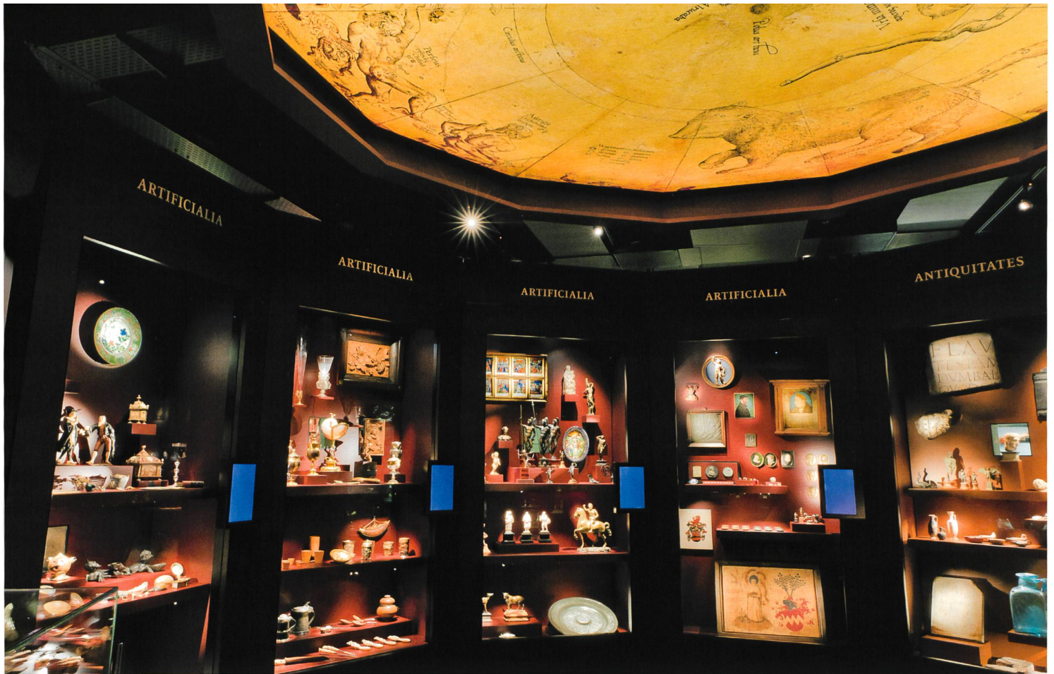
Ausstellung des Amerbach-Kabinetts im Historischen Museum Basel. Die Präsentation bemüht sich, den Charakter der Kunst- und Wunderkammer einzufangen.

struktion des Amerbach-Kabinetts wieder aufleben zu lassen. Von den Amerbach selbst wissen wir leider nicht, wie sich ihr Verhältnis im Einzelnen gestaltete. Es sind keine Berichte über Besuche auswärtiger Gäste in ihrem Haus in der Rheingasse im heutigen Kleinbasel bekannt. Das Haus selbst hat auch Veränderungen erfahren, es zeugt nichts mehr von der Amerbach'schen Sammlung dort.