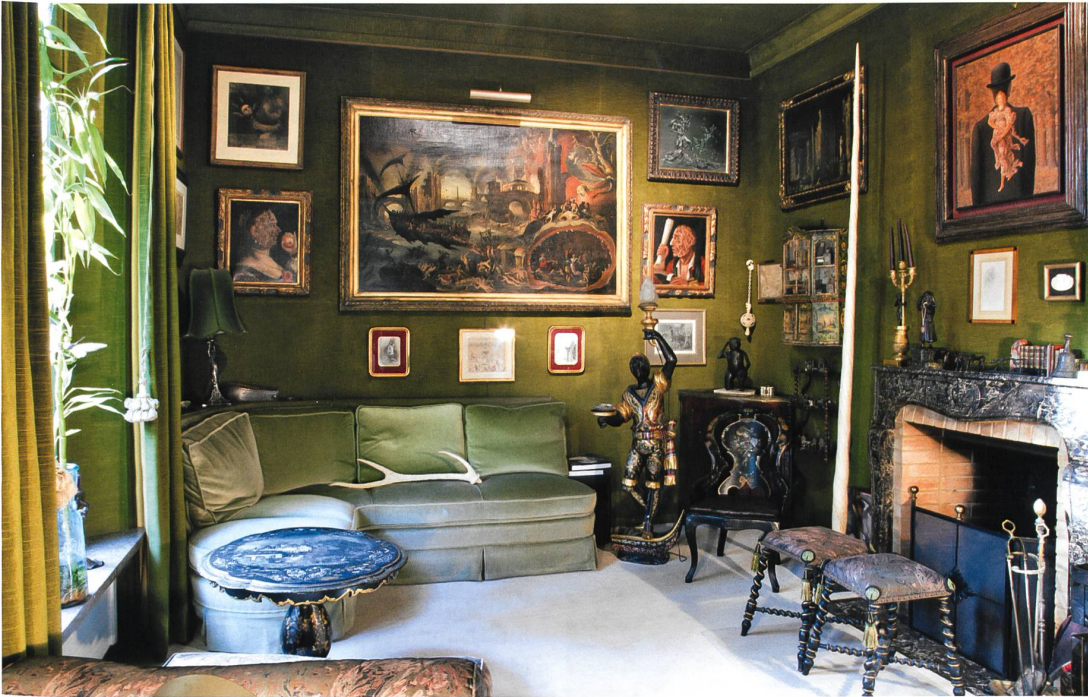
Auch private Sammlungen lassen mancherorts Reminiszenzen an die Kunst- und Wunderkammern wieder aufleben, wie dieses Beispiel aus der Schweiz zeigt. Neugier am Objekt und kennerschaftliche Vereinigung ergänzen sich.