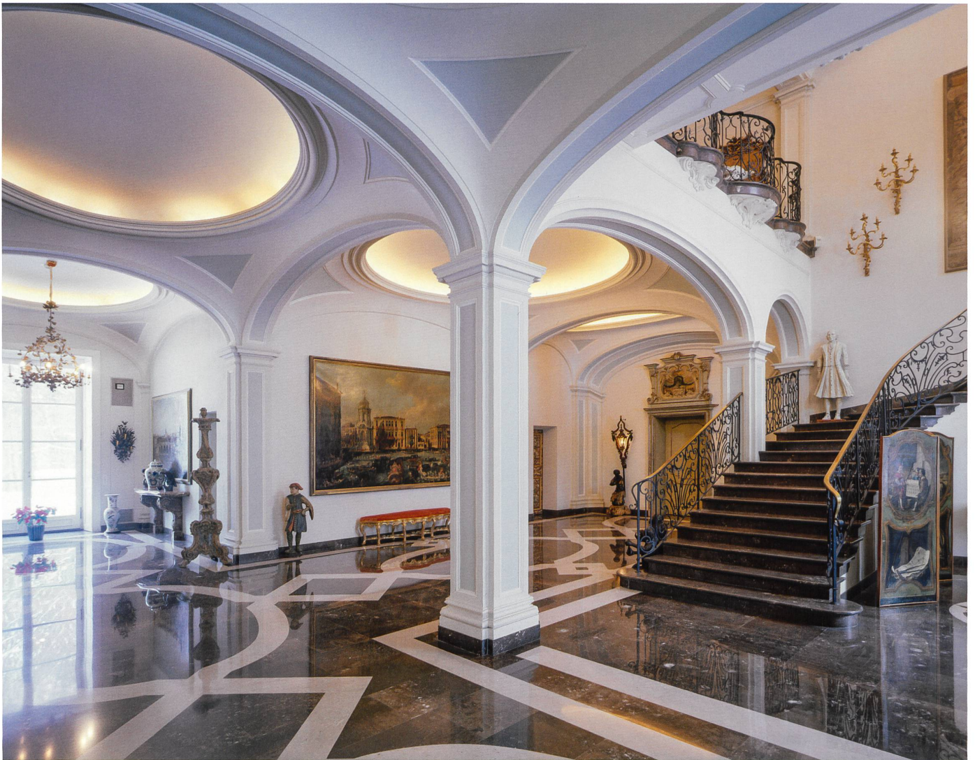
Abb.6 Villa Abegg, Eingangshalle.

vertraut. Die grosszügige Eingangshalle (Abb. 6) zeigt Einflüsse verschiedener historischer Vorbilder. Ihre in Weiss und Hellblau gestrichenen Gewölbe und die breite, in den ersten Stock führende Treppe erinnern an den Eingang zum Palazzo Madama in Turin. Der mit eingelegtem weissem und dunkelgrauem Marmor gestaltete Fussboden hat sein Vorbild unter den Arkaden des Dogenpalastes in Venedig.