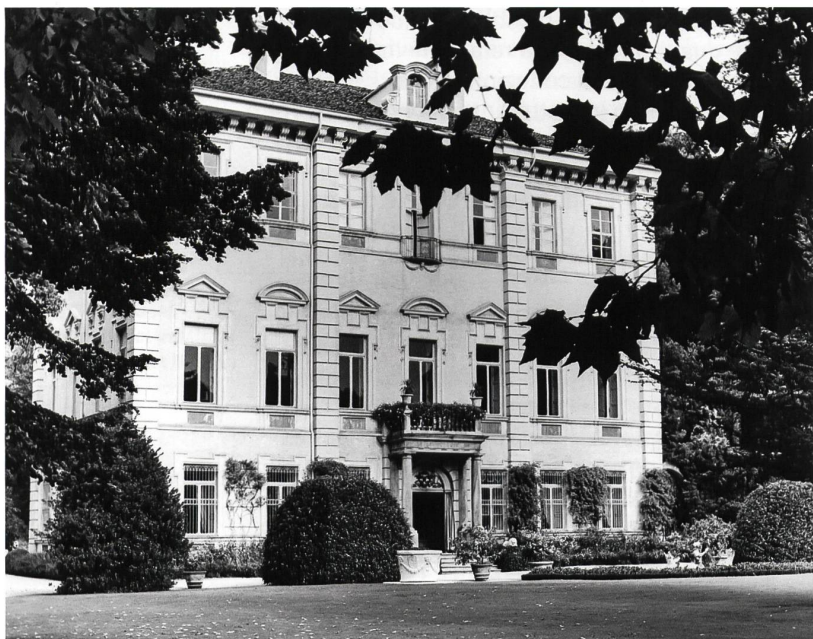
Abb. 1 Vigna di Madama Reale, Turin, um 1980.