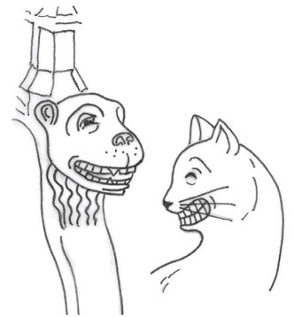
Dieser Löwe befindet sich an der Trennwand zwischen zwei Sitzen.

«Nein, du Holzkopf!», ruft Lila. «Weil wir Mäuse jagen, die dann den Menschen den Käse nicht wegfressen!» ●