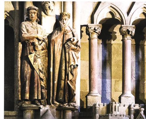
Ekkehard und Uta im Dom von Naumburg.