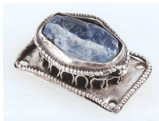
Fig. 5 Grande châsse de saint Maurice, Atelier de Saint-Maurice ?, vers 1150 et vers 1225-1230 (montage). Détail droite de la face D.