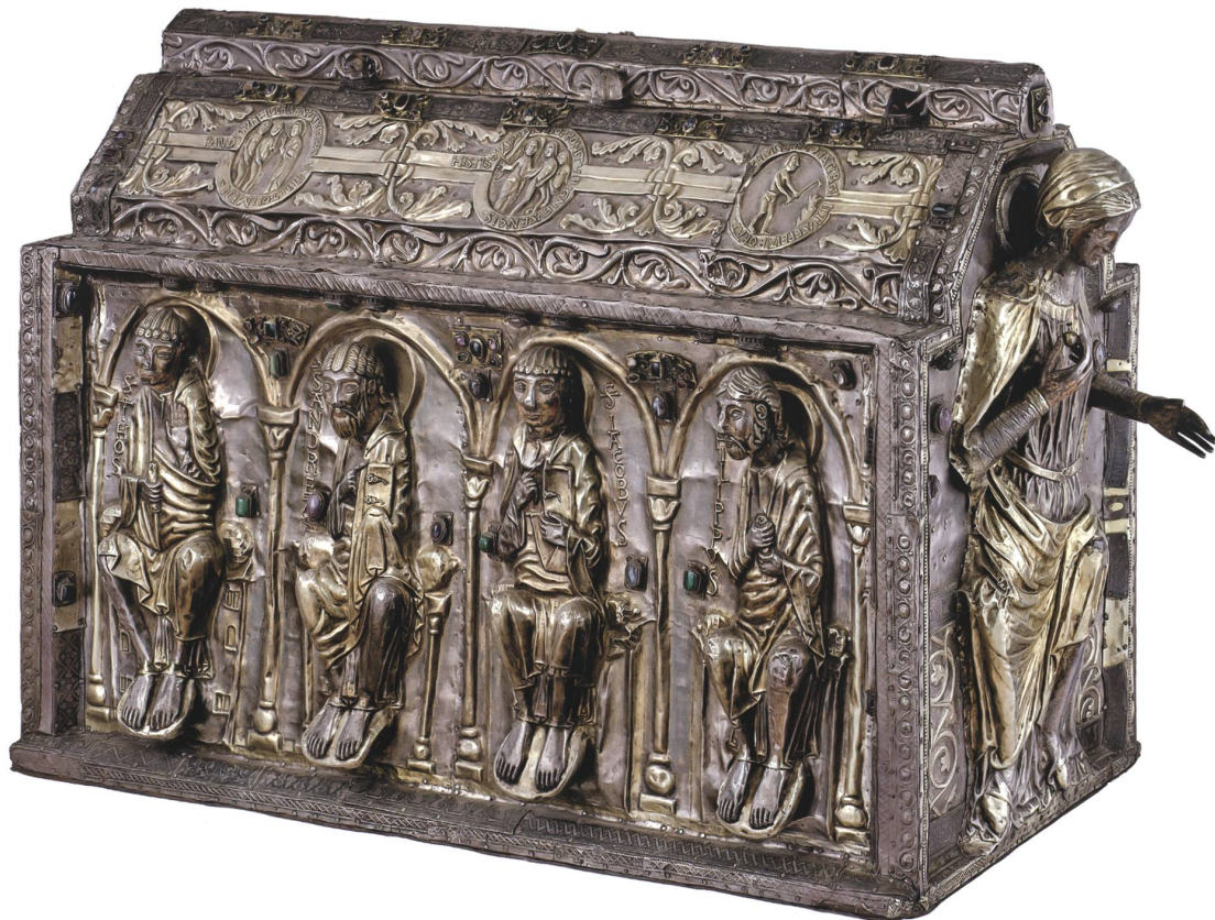
Fig. 1 Grande châsse de saint Maurice, Atelier de Saint-Maurice ?, vers 1150 et vers 1225-1230 (montage). Face B (Trésor de l'Abbaye de Saint-Maurice, inv. 2). H : 58,2 cm ; L : 80 cm ; l : 35,5 cm.

Imiter, contrefaire, c'est donc tromper les sens, ou tromper tout court : « ne tiens pas pour bonne toute belle pomme », conclut Alain de Lille. Si