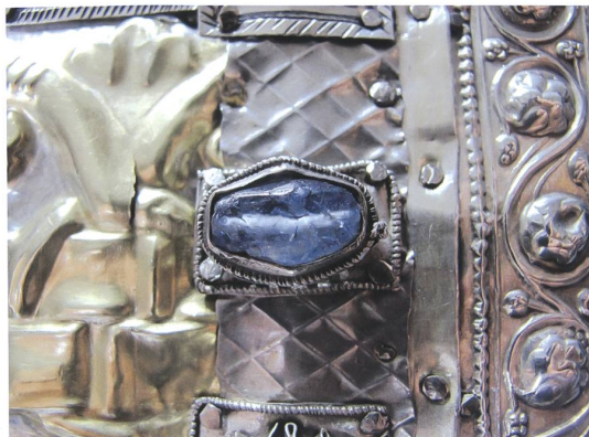
Fig. 4 Grande châsse de saint Maurice, Atelier de Saint-Maurice ?, vers 1150 et vers 1225-1230 (montage). Détail : saphir (après nettoyage).