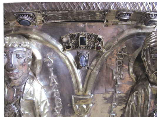
Fig. 6 Grande châsse de saint Maurice, Atelier de Saint-Maurice ?, vers 1150 et vers 1225-1230 (montage). Détail : saphir (après nettoyage).