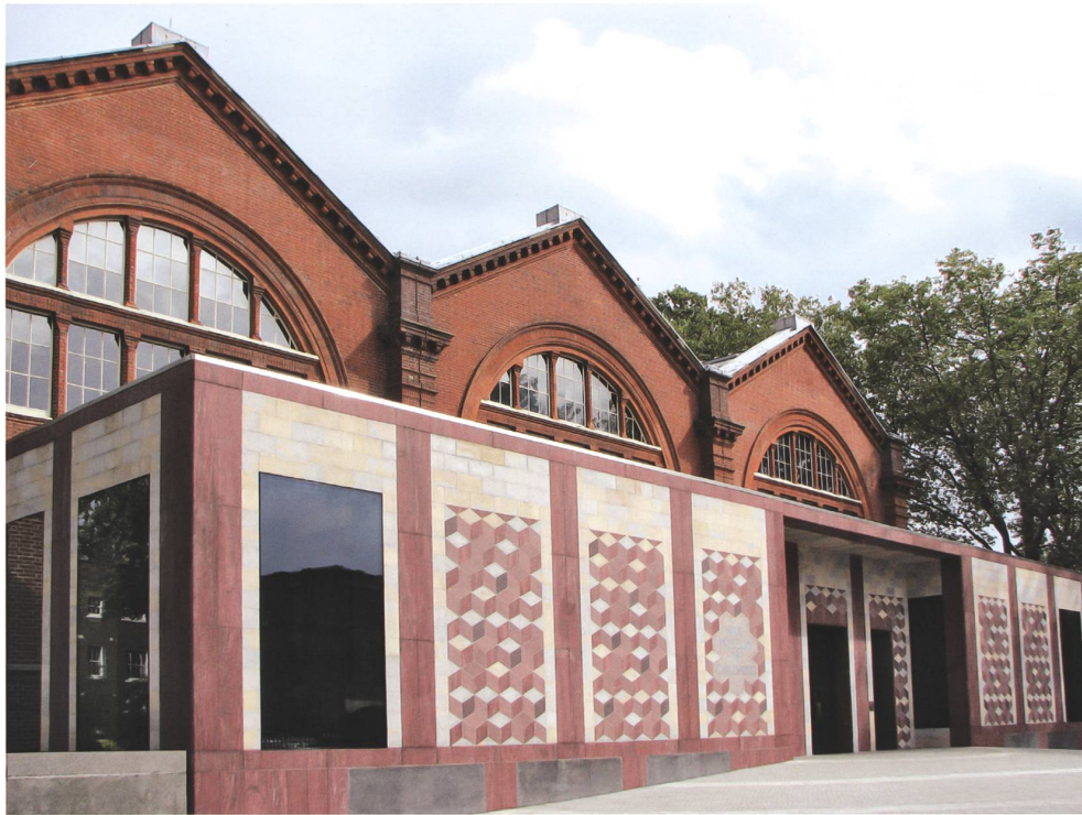
Abb. 6 Museum of Childhood, London, Caruso St John Architects, 2002–2007. Foto Cristian Bortes

Grossbritanniens verweisen und aus ehemaligen Kolonien stammen (Abb. 6). Allerdings liessen sie die Steine in sehr dünne Platten schneiden und wie Fassadenfliesen verbauen, ein optischer Bruch, der die dem Stein eigene Massivität negiert und auf die veränderten politischen und ökonomischen Verhältnisse verweist.