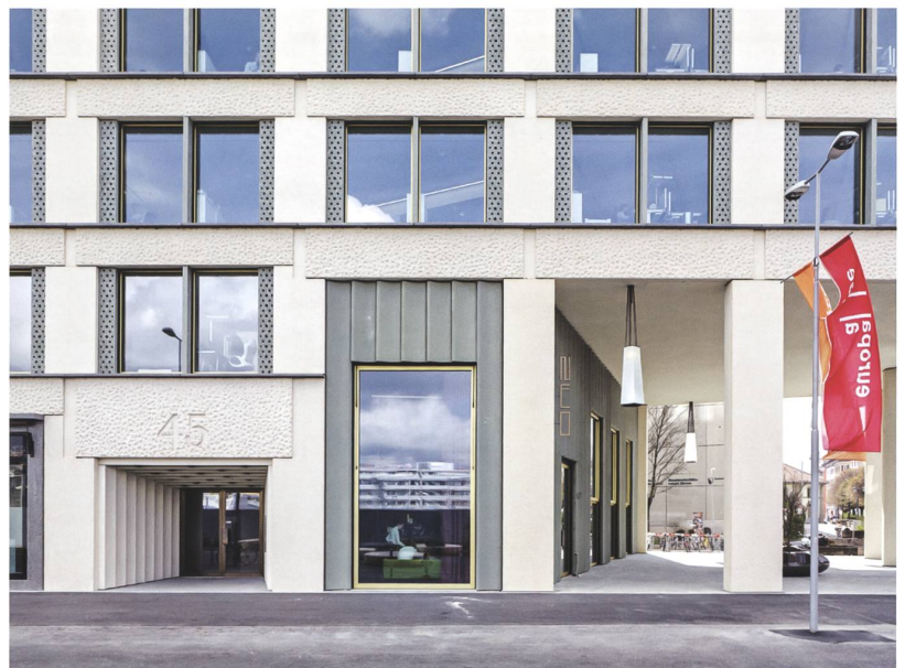
Abb. 7 Wohn- und Geschäftshaus Europapallean, Zürich, Caruso St John Architects, 2007–2013.

künstlichen Anmutung dieses natürlichen Materials und setzen sowohl im Aussen- wie auch im Innenraum Konglomeratgesteine ein (Abb. 8). Die durch Kunststeinbänder gegliederte Aussenfassade ist mit Platten aus Brannenburger Nagelfluh verkleidet, einer Natursteinart aus der Region südlich von Rosenheim, die optisch wie geschliffener Waschbeton erscheint. 9 Die Küchenarbeitsplatten in den Wohnungen wurden aus poliertem Marinace Verde, einem brasilianischen Naturstein, gefertigt und wirken wie ein hochwertiger Kunst-