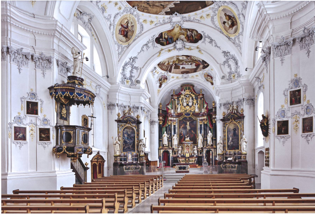
Muotathal. Wil. Pfarrkirche St. Sigismund und Walburga. Blick nach Osten. Foto Georg Sidler, Schwyz, 2021