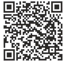
Scannez le code QR et découvrez la salle Marine dans la maison de Courten qui abrite aujourd'hui la Fondation Rilke !