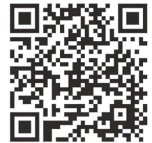
QR-Code scannen und die Pfarrkirche St. Sigismund und Walburga in einer 360°-Ansicht erleben!