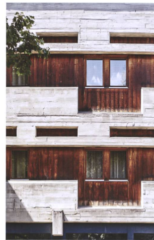
Le Feriendorf de Fiesch. Exemple du début du tourisme de masse en Suisse, construit en 1967 par les architectes Paul Morisod, Jean Kyburz et Édouard Furrer.

En parallèle, différents établissements scolaires, institutions, communes ou sociétés sportives vont commencer à organiser des camps de ski régionaux pour leurs élèves et leur jeunesse. Ainsi, en 1964, l'institution Caritas lance un