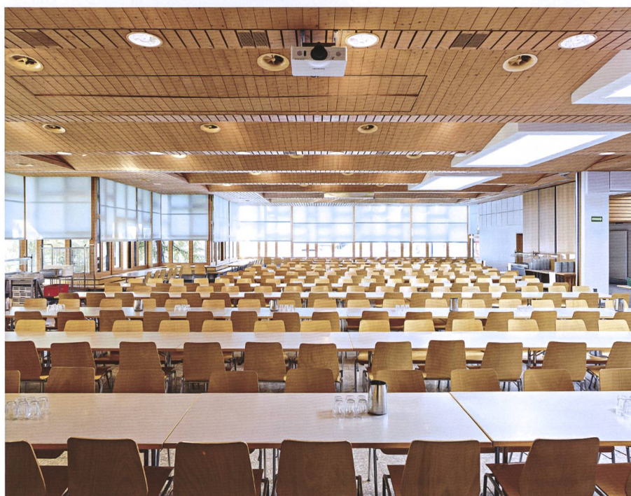
Les fameux lits à deux étages – avec une capacité inédite de mille lits – dans le Feriendorf de Fiesch et la salle à manger.