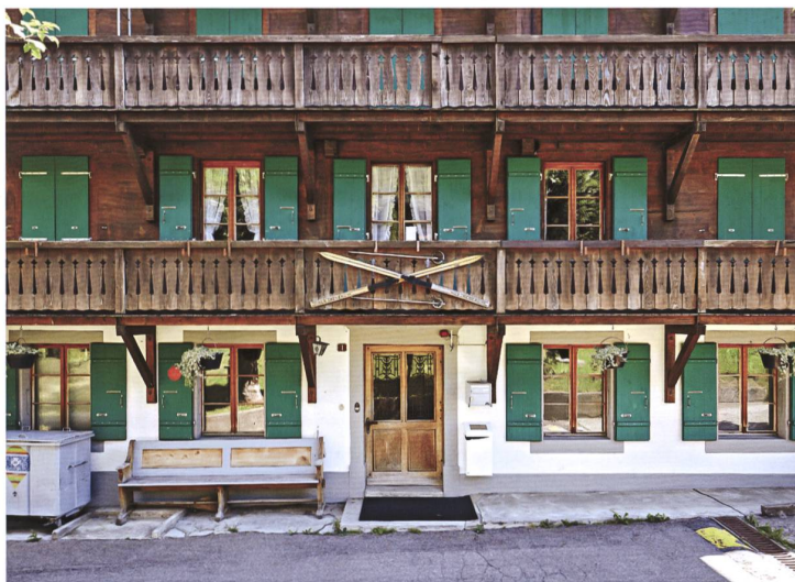
Le Chalet La Cheneau à Château-d'Oex, une ancienne maison d'habitation datée de 1770, est utilisée à partir de 1975 par des écoles de la Ville de Vevey pour organiser des camps de ski.