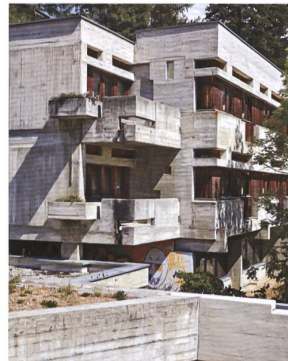
Ferierendorf Fiesch. Une construction en béton et bois qui domine la nature par sa taille et son implantation.