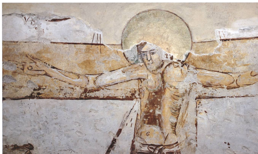
Fig. 5 Part. del Cristo crocifisso, dopo l'intervento di restauro del 2020.

Fino al 2020 i dipinti apparivano fortemente appesantiti dalle numerose stuccature, dai ritocchi alterati e dalle vaste integrazioni "a neutro", in alcune parti completate da velature a continuare l'antica decorazione (fig. 3): la varietà di colore e aspetto delle integrazioni e l'assenza di una chiara e unitaria impostazione metodologica ostacolavano fortemente la lettura dell'insieme dei frammenti pittorici.