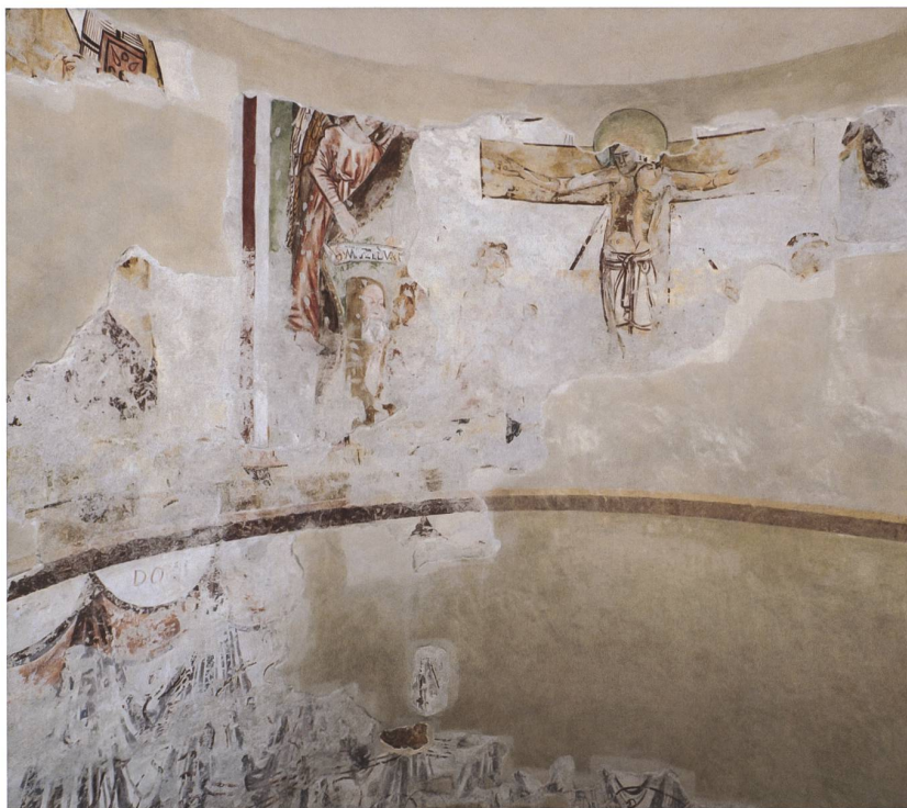
Fig. 4 Veduta del tamburo absidale.