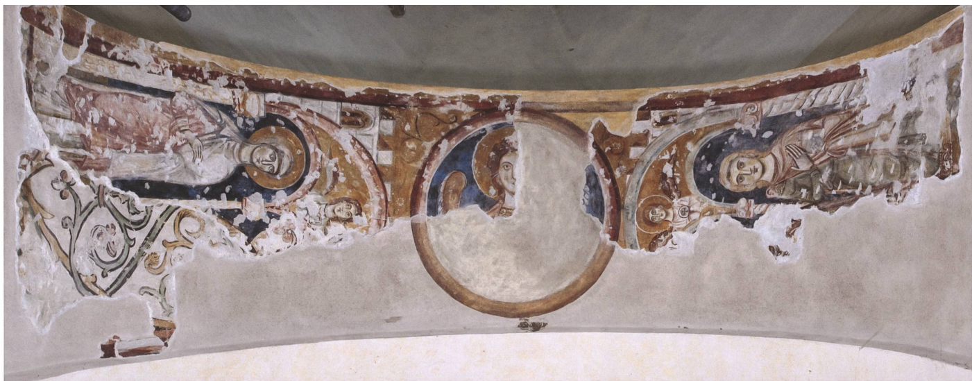
Fig. 7 Veduta del sottarco absidale, dopo il restauro del 2020.