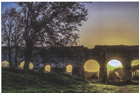
Im Parco degli Acquedotti.

In den Ausstellungsräumen der Kapitolinischen Museen findet sich die Crème de la Crème antirkömischer Plastik: Marc Aurels Reiterstatue, die Kapitolinische Venus sowie der Dornauszieher fordern unsere ästhetische Analyse.