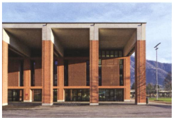
Der Portikus des Gebäudes Gottardo.