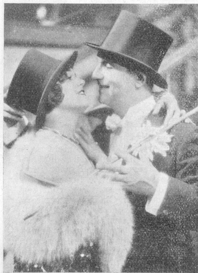
Michael Bohnen et Olga Tschechowa in Zwei Krawatten .