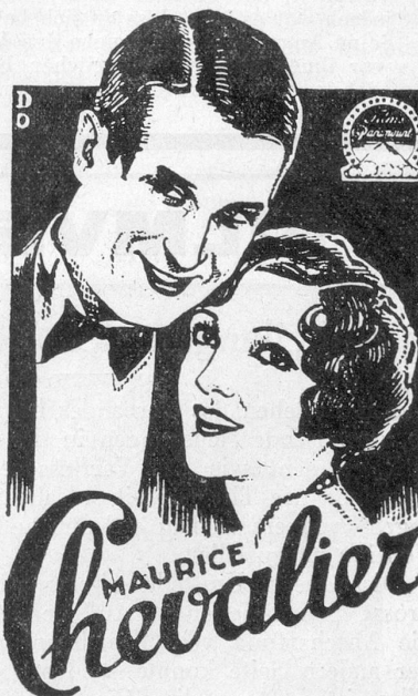
Maurice Chevalier avec sa partenaire Claudette Colbert dans son premier film parlant français La Grande Marc .