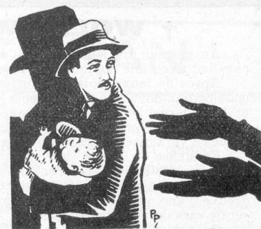
Une scène du film parlant français Toute sa vie .

Des femmes jolies et fines, les corps moulés en d'éclatants maillots, se promènent, souriantes sous des ombrelles minuscules... Voici des baigneurs aux