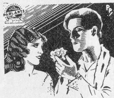
Dennis King & Jeanette MacDonald in einer Szene der ersten Sprechfilm-Oper der Paramount Der König der Vagabunden.

Signalons d'autre part que, poursuivant son programme d'extension, le Service de Distribution Haik va organiser très prochainement son agence Suisse.