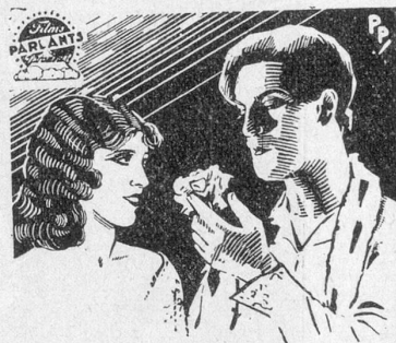
Dennis King & Jeanette MacDonald in einer Szene der ersten Sprechfilm-Oper der Paramount Der König der Vagabunden.

Signalons d'autre part que, poursuivant son programme d'extension, le Service de Distribution Haik va organiser très prochainement son agence Suisse.