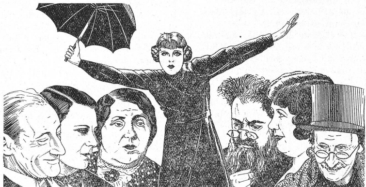
Faut-il les Marier ?

Le sixième film, Une Jeune Fille et un Million , se tourne actuellement à Vienne. Les deux principaux interprètes sont de nouvelles jeunes vedettes engagées en exclusivité par les Films Osso, Mlle Magdeleine Ozeray et Claude Dauphin et c'est M. Max Neufeld, le réalisateur de Monsieur, Madame et Bibi , qui le met en scène. Mlle Magdeleine Ozeray, qui fut la protagoniste de Mal de la Jeunesse au théâtre de l'Oeuvre, puis au studio des Champs-Élysées, s'est révélée dans la pièce de