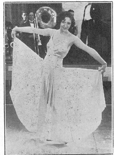
Service de Nuit

» Néanmoins je me sens à mon aise... » Diable! les Vignes du Seigneur ... N'est-ce pas mon cheval de bataille? »